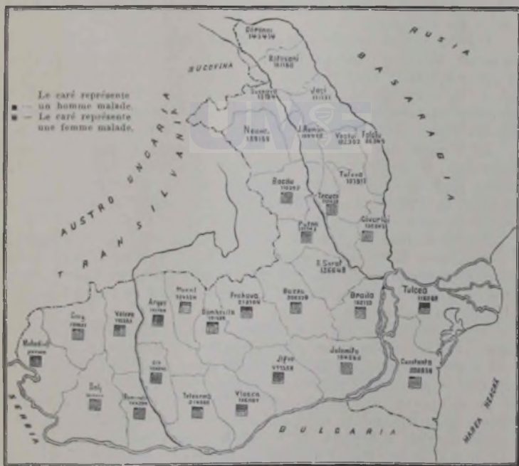
Carte représentant la distribution des lépreux d'après les départements.

Les naissances en Roumanie occupent le 4. Rang en Europe avec une proportion de 41,5 p. m.