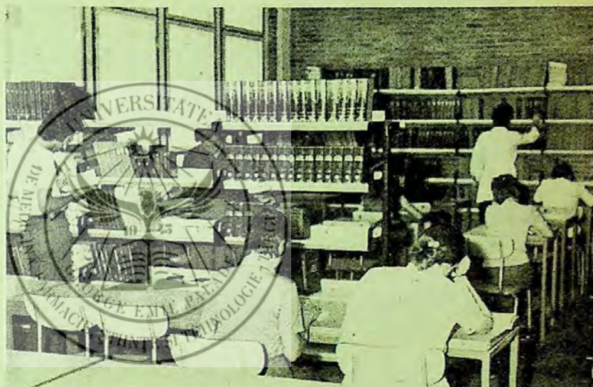
„Am dezvoltat în cadrul accesului liber la raft o zonă de informare...“