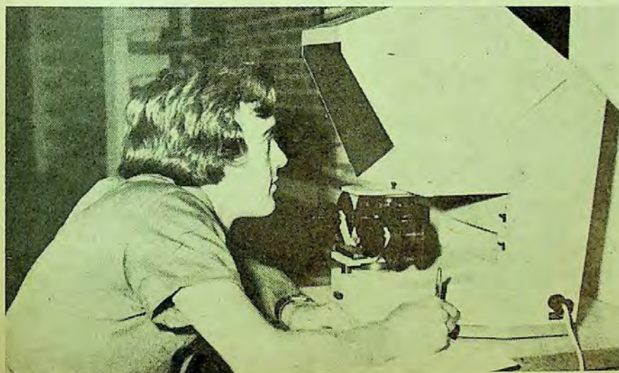
„Pentru optimizarea condițiilor de informare au fost introduse în circulație și o seamă de materiale audio-vizuale“.