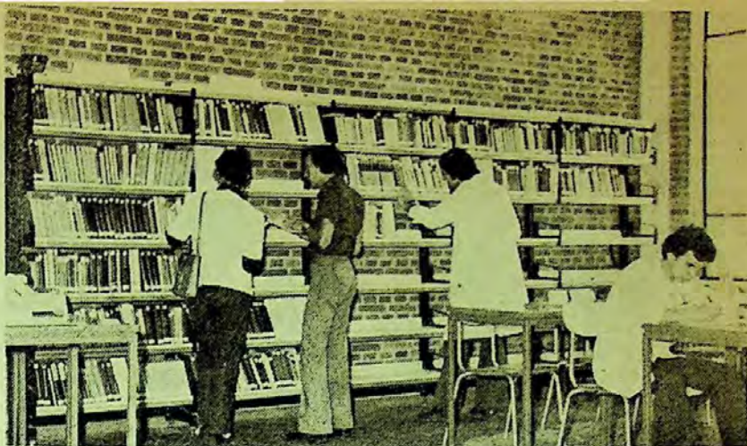
„... principalul câștig: trecerea de la biblioteca tradițională, închisă, la cea de tip deschis“.

Biblioteca Facultății de fizică se va adresa și în continuare în primul rând studenților și cadrelor didactice din facultate, chiar dacă printre beneficiarii ei se numără acum și cercetători de la I.F.A. și I.F.B., elevi de la Liceul de fizică etc. Oricum, în concordanță cu procesul tot mai intens de integrare a învățămîntului cu cercetarea și producția, cu cerințele noi de lectură și de informare ce decurg din aceasta, putem spune că avem, într-un fel, un public calitativ nou. Acest fenomen se va reflecta implicit în colecțiile bibliotecii. Eforturile în acest sens vor fi corelate cu ale celorlalte biblioteci de specialitate de pe platformă, din cadrul I.F.A. și I.F.B., ceea ce va permite și o mai rațională folosire a resurselor bugetare. Dincolo de posibilitățile oricum limitate ale colecției noastre, satisfacerea integrală a nevoilor de studiu și informare, mai pretențioase în cazul studenților din anii IV și V, în curs de specializare, și mai ales ale cadrelor didactice antrenate în procesul de cercetare, se realizează prin împrumut interbibliotecar. Intreținem relații de acest gen cu toate biblio-