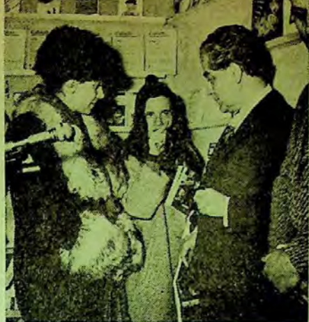
Lume multă... Se recită din Eminescu.

Până acasă, un popas în vitrina Sălii Dalles pentru o scurtă răsfoire (poate s-au strecurat și pagini necipărite).