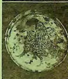
CERAMICA ROMÂNESCĂ TRADIȚIONALĂ

Dacă ne permiteți, o numim — fiindcă se poate și, mai ales, fiindcă merită — o carte a lutului , a lutului românesc, devenit, prin mină și suflet de artist de cele mai multe ori anonim, obiect pentru viața cea de toate zilele și istoria cea de toate timpurile, argument de civilizație și cultură autohtonă. Conceptul, în primul rînd, ca lucrare aplicată asupra originalității olăriei românești tradiționale, albumul constituie, totodată, un studiu de artă comparată care, în mod expres, continuă celebra monografie a lui David Talbot Rice — apărută în urmă cu cîteva decenii — despre ceramica bizantină, prin valorificarea descoperirilor ulterioare acestui tom de referință.