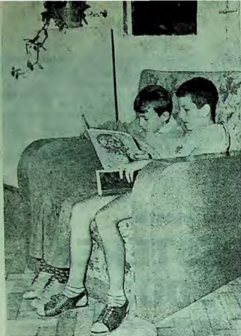
O formă sui-generis a lecturii pe loc.

șurat la locul de muncă al tinerilor, în întreprinderi și instituții, în școli, ca și în cluburile frecventate de ei. Scopul: atragerea în sfera lecturii a unui număr cât mai mare de tineri din straturile active ale populației. Acțiuni speciale au fost adresate tinerelor fete și tineretului școlar.