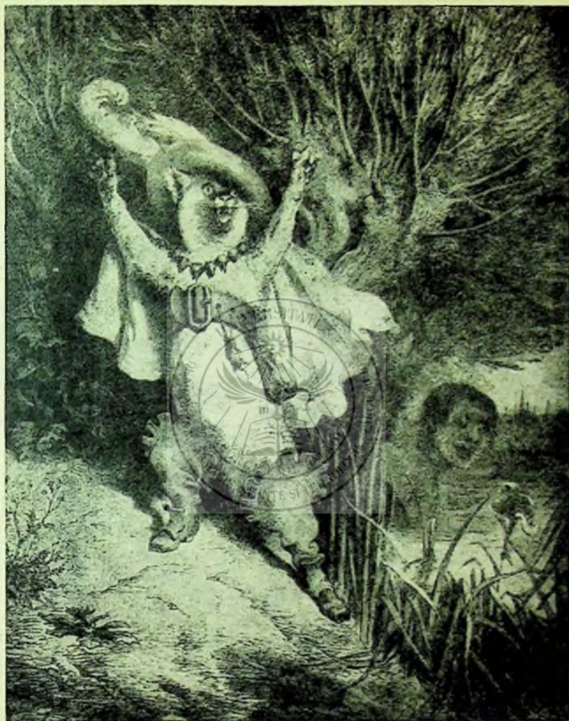
Motanul Incălțat, acest teribil glob-trotter... Ilustrație de Gustave Doré la Contes de Perrault. Paris, J. Hetzel, 1883.