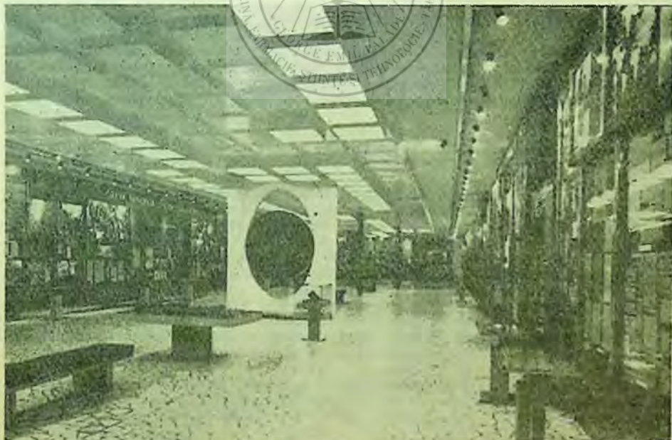
Aspect din sala a U-a a Muzeului (1918—1934)

Răsturnarea dictaturii fasciste și eliberarea țării de ocupația străină — se subliniază prin exponate — au marcat începutul revoluției populare din România, inaugurînd o nouă etapă în dezvoltarea țării. Exponatele redau imaginea luptei clocotitoare a maselor conduse de partid pentru sprijinirea frontului antihitlerist, lichidarea rămășițelor feudale și înfăptuirea reformei agrare, democratizarea aparatului de