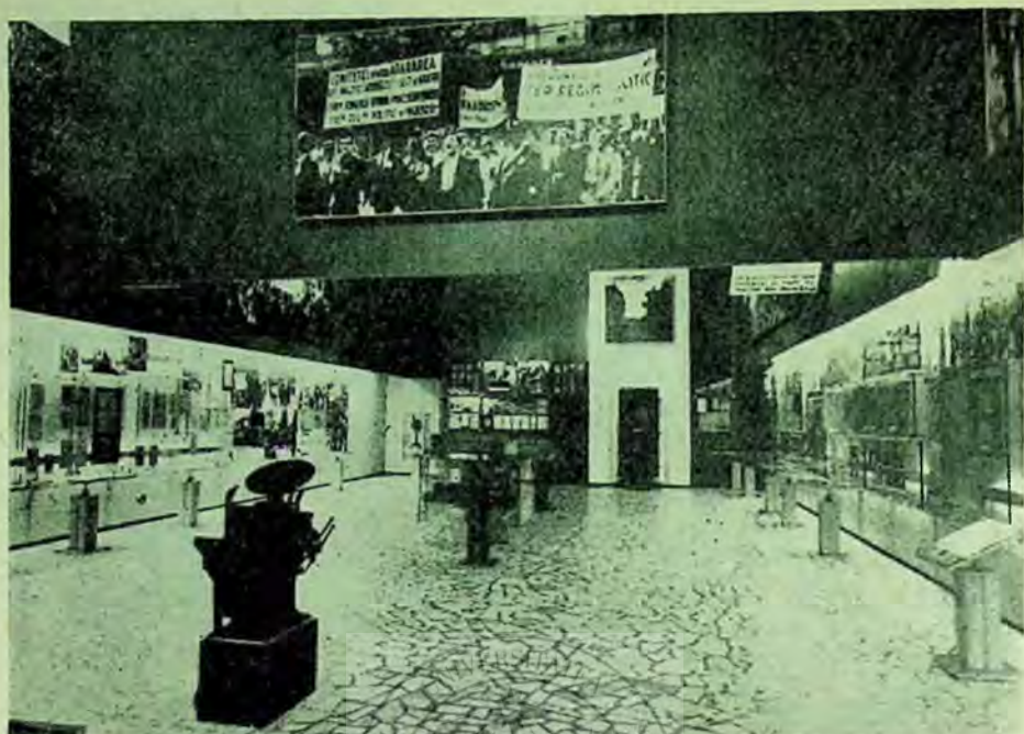
Aspect din sala a VI-a a Muzeului (1934—august 1940)

stat prin alungarea elementelor reacționare și înlocuirea lor cu primari și prefeți aleși de popor, refacerea economiei naționale. În focul acestor lupte și ca rezultat direct, a fost instaurat, la 6 martie 1945, guvernul de largă concentrare democratică condus de Dr. Petru Groza.