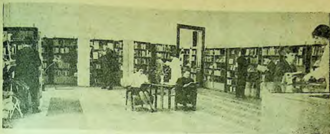
Secție de împrumut (sala a II-a)

citorești; Filozofie. Ateism; Probleme politice și economice; Stat și drept; Învățământ-pedagogie; Istoric; Geografie; Matematică; Fizică-chimie; Științele naturii; Medicină; Științe tehnice-inginerie; Construcții de mașini; Electrotehnică; Construcții civile și industriale; Chimie-industrială; Industrie textilă; Alte industrii și meserii; Agricultură. Urmează Literatura română; Literatura universală (așezată pe țări); Artă. Muzică. Teatru; Viața oamenilor de seamă; Lingvistică.