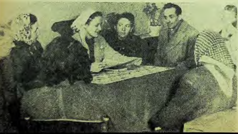
Lectură la cercul de citit dîn comuna Izvoarele

O manifestare cu cartea la Izvoarele are acum într-adevăr un caracter de masă. N-am să uit seara de întrebări și răspunsuri pe tema Superstițiile sînt dăunătoare omului și progresului . Ce discuții s-au mai încins. Oamenii cresc de la un an la altul... I-au ajutat și cărțile