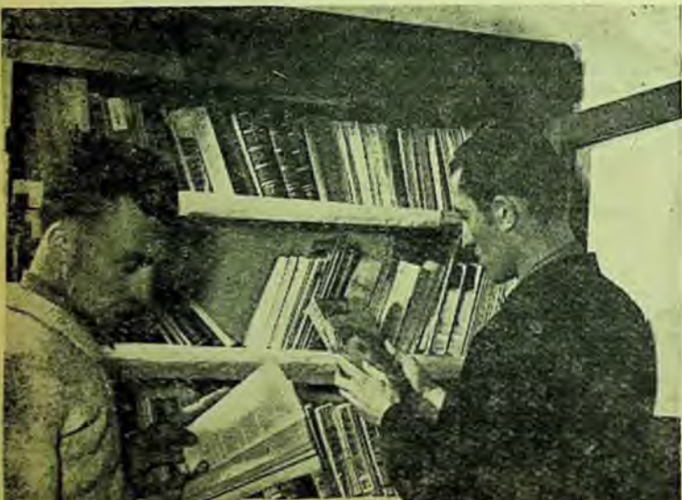
— Pe care carte s-a ales? Toate sînt interesante! În sala culturală a G.A.S. din comuna Urleasca, raionul Brăila.

Tot la Dej există și sediul unui G.A.S. cu secții la Nima și Mihăești-Ciceu. La sediu, aranjate frumos în dulap stau cîteva sute de volume. Oare la secții sînt biblioteci? — mă întreb. Ghicindu-mi parcă gîndul, responsabilul bibliotecii îmi dă un răspuns afirmativ. Într-adevăr, la secția zootehnică de la Nima există o sală culturală și un dulap cu cărți. Din păcate, cărțile nu pot fi folosite: sînt vechi, neinteresante. Lucrătorii de la această secție vor însă să citească. Cum să se rezolve această problemă? C-un mic efort din partea comitetului sindical al gospodăriei s-ar fi găsit și rezolvarea: o parte din cărțile de la sediu se puteau transporta la Nima. Se pare că, această