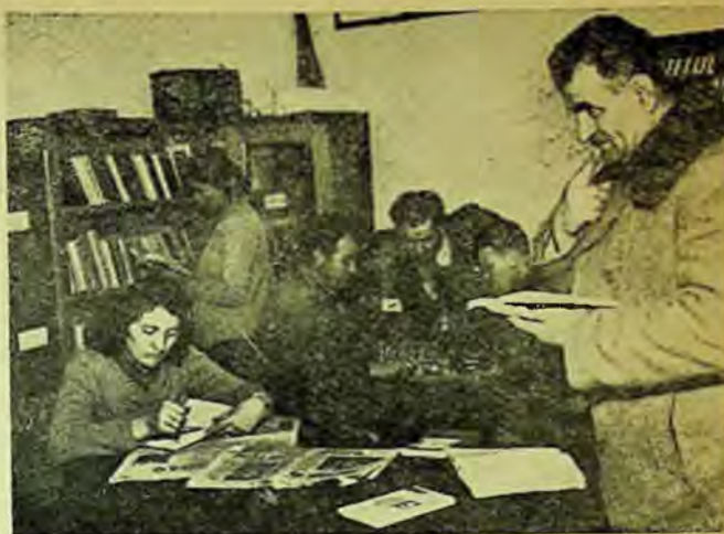
Un aspect din sala culturală a G. A. S. Ivănești, regiunea București.

Cele cîteva S.M.T.-uri și G.A.S.-uri vizitate ne permit să tragem unele con-