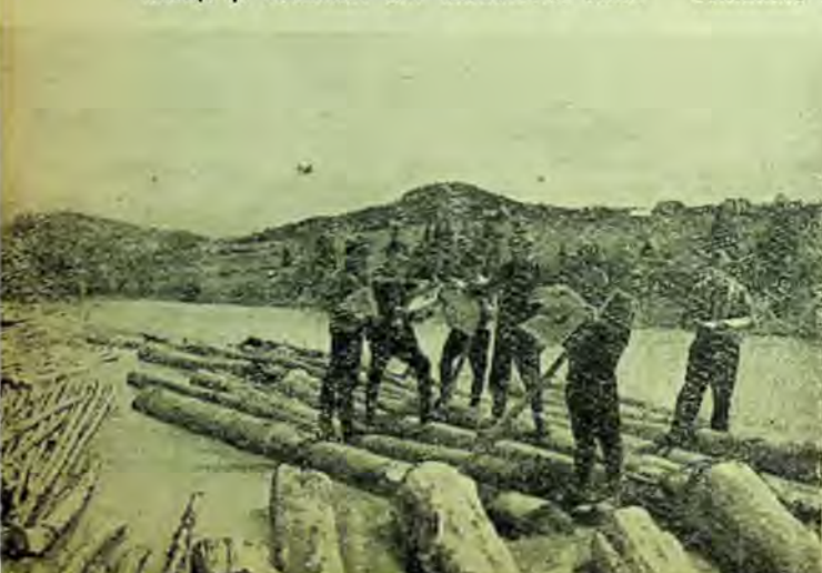
— A sosit presal la schela de prins și legat plute, de la întreprinderea forestieră Vatra-Dornei.

În funcție de condițiile existente în fiecare întreprindere forestieră, colaborarea dintre bibliotecile sindicale și cele din sistemul așezămintelor culturale capătă forme variate. Colaborarea se poate extinde și în direcția organizării și funcționării bibliotecilor mobile la gurile de exploatare, prin încheierea unor angajamente între bibliotecile sindicale și cele comunale sau raionale. În aceste angaja-