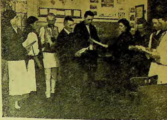
Biblioteca Ana Bălașa prezintă crescătorilor de animale, unele cărți din expoziție.