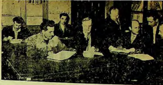
La biblioteca tehnică a Ateliereleor de reparat material rulant din Pașcani

În schimb la această fabrică, biblioteca Casei de cultură a sindicatelor Iași a organizat 6 biblioteci mobile în diferite secții, precum și numeroase manifestări de masă, între care cităm: Întîlnirea tovarășului Ion Niculi cu 200 cititori muncitori (de la fabrica „Țesatura”, fabrica de mobilă și Atelierele C.F.R.