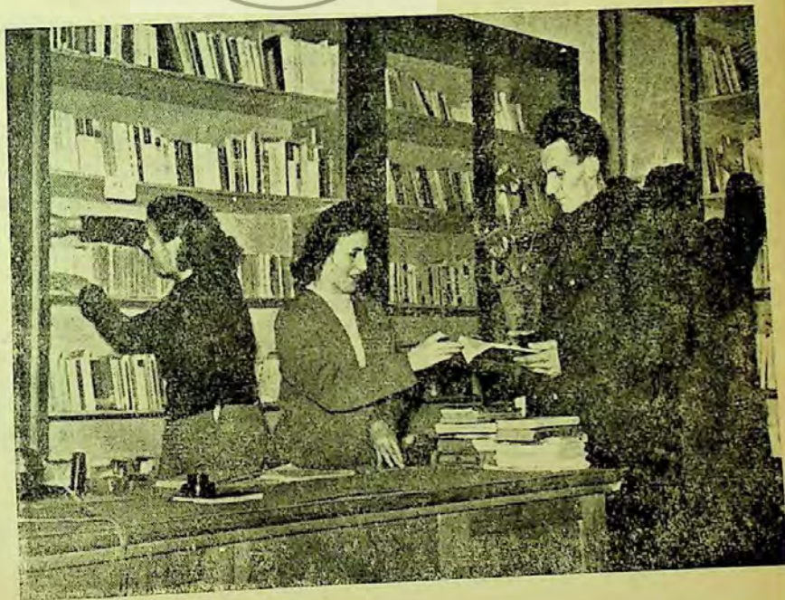
La biblioteca Clubului salariaților C.F.R.-Iași

Biblioteca își informează cititorii asupra lucrărilor nou intrate, fie prin înștiințări directe, fie prin „Caietul semnalizator“ (care cuprinde întreg materialul adnotat), ce se utilizează în sectoarele de producție și serviciile funcționale. După studierea amănunțită a materialelor în funcție de problemele specifice sectorului respectiv, se face producția în fața muncitorilor, informându-i