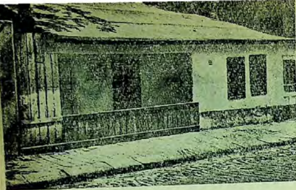
Casa conspirativă a partidului, de pe strada Ecolui nr. 20, unde se tipărea ziarul ilegal „Scinteia”.

și multe alte acțiuni locale de luptă ale proletariatului din toate regiunile țării. Gazeta cuprindea articole despre revoltele țărănilor de la Gropița (Iași), Valea Ghimeșului, Dobrești (Muscel), Mădăraș (Ciuc) etc., ce nu voiau să accepte birurile grele, executările silitе, consecințele nefaste ale legiuirilor burghezo-moșierești.