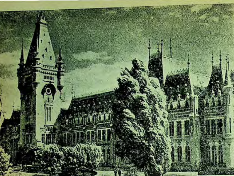
Palatul Culturii din Iași, în care funcționează Biblioteca regională.