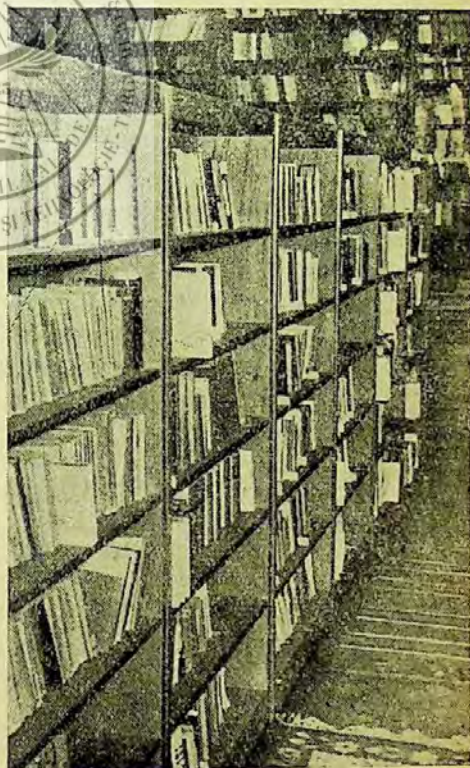
Aspect din depozitul de cărți

Este adevărat că după primul război mondial, prin numirea în fruntea acestei biblio-