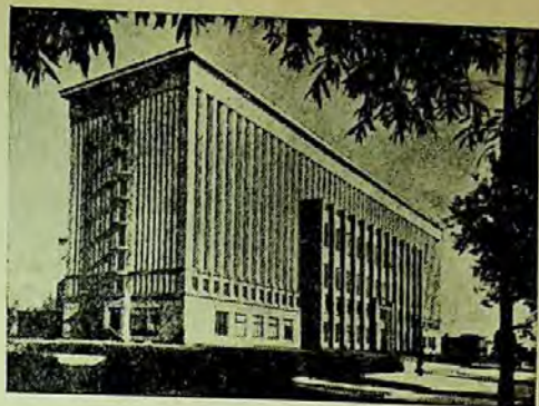
Clădirea bibliotecii Jagellonă

Am vizitat cele 7 depozite de cărți ale noii clădiri, impunătoare prin proporții. Înzestrate cu aparate pentru măsurarea și reglarea temperaturii și umidității, cu lumină difuză, bine izolate, cu mijloace moderne pentru transportul publicațiilor la săli, s-a spus des-