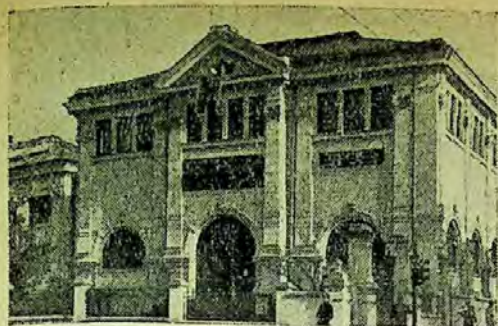
Clădirea bibliotecii regionale Craiova

Sala din stînga intrării cu covoare pe jos, luminată mult mai puternic, avea în mijloc o masă lungă căptușită cu postav roșu.