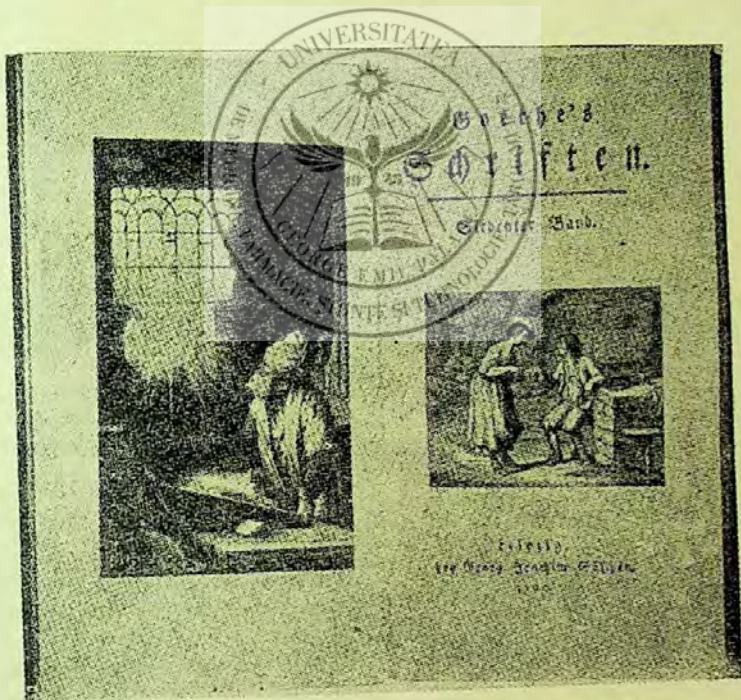
Reproducere după prima ediție din Faust (1790)

După revista „Der Bibliotekar“ nr. 1/1957