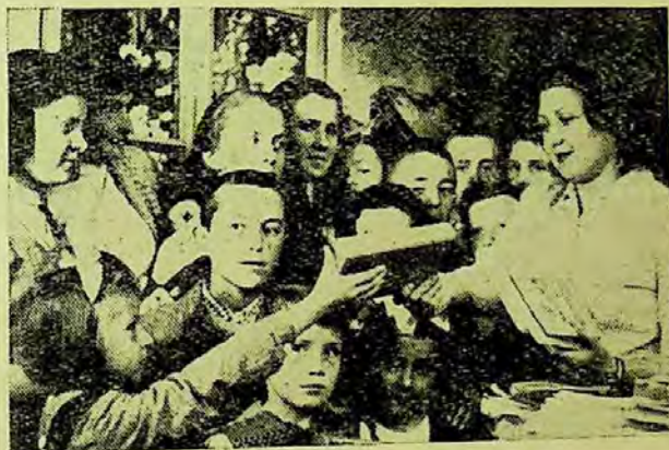
Imprumutul de cărți la o bibliotecă de casă în orașul Piatra-Neamț