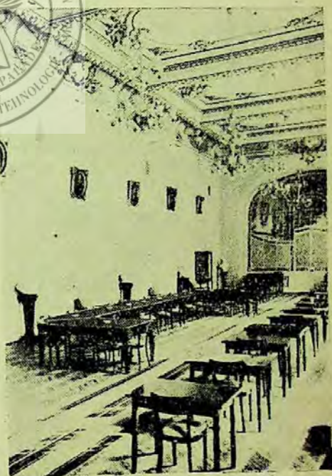
Una din sălile de lectură

Sarcinile noi impuse bibliotecii cer imperios cadre calificate. În acest scop, în decembrie 1951 se organizează pe lîngă Biblioteca Centrală o școală de bibliotecari care a reușit în decurs de doi ani să pregătească bibliotecari calificați. Această școală a fost urmată de 36 bibliotecari din