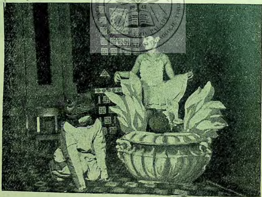
Tablou din povestirea „Mărunțica”

Și la ghicitorile literare am aplicat o formă nouă de prezentare. În trecut, aceste ghicitori le-am organizat numai pentru copiii mai mari, de la clasa a IV-a în sus,