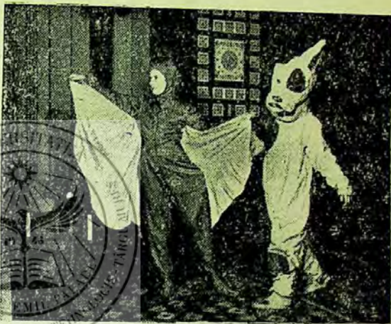
Prezentarea povestirii „Prima vînătoare”

parte a micilor cititori au venit să ceară cărțile care fuseseră reprezentate prin picturi. Intre acestea a fost și Nică fără frică de Nina Casian, care acum circulă foarte mult printre copiii noștri. Văzînd acest lucru, ne-am hotărît să dăm mai multă atenție popularizării cărții prin prezentare de imagini, trecînd chiar la prezentarea de scene vii. Dramatizarea unei cărți a fost o formă folosită mai de mult în bibliotecă noastră. De data aceasta însă, am introdus prezentarea pe scenă a mai multor cărți. Eroiile cărților sînt astfel aduși în fața spectatorilor și puși, fie să povestească un fragment din acțiunea lor, fie să interpreteze acest fragment cu mijloace teatrale.