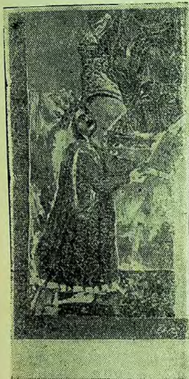
Ștefan cel Mare — miniatură din Tetraevanghelul de la Humor, 1473.

500 de ANI de la urcarea pe tron a lui ȘTEFAN CEL MARE