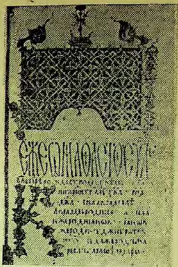
Pagină cu frontispiciu din evangheliarul din 1502.

Manuscrisele din vremea lui Ștefan cel Mare, prin miniaturile și ornamentele și scoarțele lor sînt adevărate opere de artă și obiecte de valoare. Ele sînt un exemplu de îmbinare fericită a elementelor culturii autohtone cu influențele bizantine și ale Renașterii italiene și o dovadă grăitoare a nivelului înalt atins de cultura moldoveană sub domnia marelui voievod.