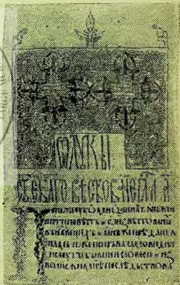
Pagină cu frontispiciu din evangheliarul din 1493.