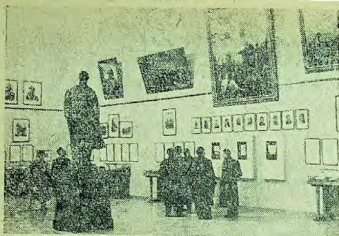
Sala Mării Revoluții Socialiste din Octombrie la muzeul V. I. Lenin—I. V. Stalin

eliberării celor ce muncesc este drumul drept al luptei spre victoria revoluției comuniste.