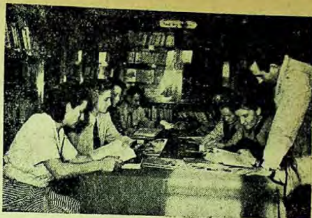
Biblioteca I.P.R.O.F.I.L. „Simó Géza” din Tg. Mureș