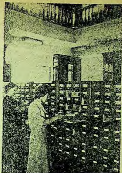
Sala cataloagelor la biblioteca universității Lomonosov

Foarte important este sistemul de împrumut al manualelor pe durata predării materiei respective. Conform instrucțiunilor Ministerului Învățămîntului superior, bibliotecile nu sînt obligate să aibe manuale într-o asemenea cantitate încît să asigure fiecărui student un manual. De aceea ni se pare logic că în