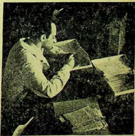
Dosare cu tăieturi din ziare la Biblioteca Centrală Universitară din Cluj