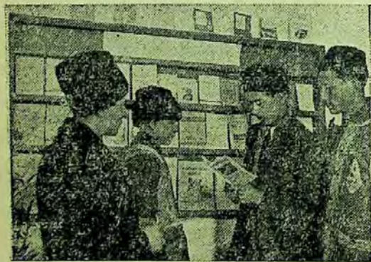
Expoziție de cărți agrotehnice în com. Cojasca

Cărțile și broșurile, ziarele și revistele agrotehnice au fost grupate pe principalele lucrări agricole ce se execută primăvara. Astfel, de o parte au fost expuse cărți ca: Sămînța sănătoasă și de soi dă recolte mari, Pregătirea semințelor pentru semănat etc., care arată condițiile ce trebuie să îndeplinească semințele pentru încolțire, procedeele pentru selecționarea lor etc.: de altă parte cărți și broșuri ca: Pregătirea terenului pentru însămînțările de primăvară, Cultura floarei soarelui de Olteanu Florica și altele, care vorbesc despre lucrările solului și metodele de semănat a diferitelor plante, dîndu-se o atenție deosebită cărților care descriu metoda semănatului porumbului și cartofului în cuiburi așezate în patrat cum sînt: Să aplicăm metode avansate în