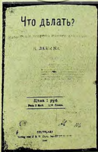
Coperta lucrării: Ce-i de făcut?

Din această perioadă datează și primele lucrări teoretice ale lui Lenin. În primăvara și în vara anului 1894 Lenin scrie celebra lui carte Ce sînt „prietenii poporului“ și cum luptă ei împotriva social-democrațiilor . Geniala lucrare a lui Lenin care a fost șapirografiată clandestin numai în citeva zeci de exemplare, se află expusă în vitrinele muzeului. Lucrarea epocală a lui Lenin a demascat caracterul reacționar al narodnicismului, arătînd totodată că adevărații prieteni ai poporului sînt marxistii, că drumul