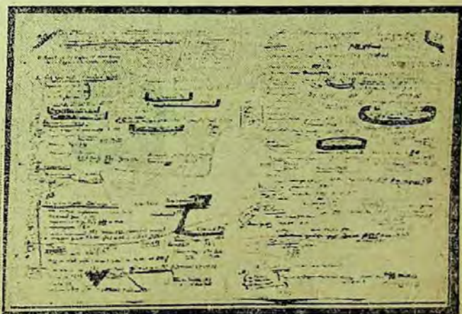
Detaliu din manuscrisul „Imperialismul, stadiul cel mai înalt al Capitalismului” (pag. 30—31)

Evenimentele atît de cunoscut ale anului 1917 se perindă prin fața ochilor