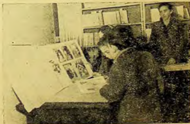
La secția de copii a bibliotecii regionale Iași.

Călătoria literară a început printr-o convorbire cu copii despre Iașul cultural, povestindu-li-se că aici au trăit cei mai mari scriitori ai noștri: Alecsandri, Alecu Russo, M. Kogălniceanu, C. Negruzzi, I. Creangă, M. Eminescu, M. Sadoveanu și arătându-li-se rolul ce l-au jucat acești scriitori în dezvoltarea vieții literare a țării noastre. Pe parcursul călătoriei, care a început de la bibliotecă, ajungând de pildă, la casa lui V. Alecsandri s-a vorbit copiilor despre operele acestui scriitor care se găsc în bibliotecă, des-