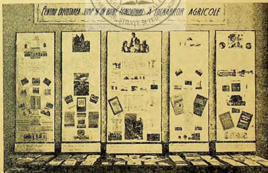
Expoziție de cărți la biblioteca regională Bacău

În regiunea noastră funcționează 672 biblioteci raionale, sătești, ale căminelor culturale și ale colturilor roșii din gospodăriile agricole colective. Ținînd seama de frumoasa activitate desfășurată de unele dintre aceste biblioteci, preocuparea secțiunii culturale regionale și a bibliotecii centrale regionale Bacău a fost de a generaliza experiența bibliotecilor fruntașe, în scopul mobilizării și antrenării tuturor bibliotecilor din regiunea noastră la intensificarea răspîndirii cărții agrotehnice în rîndurile țăranimii muncitoare.