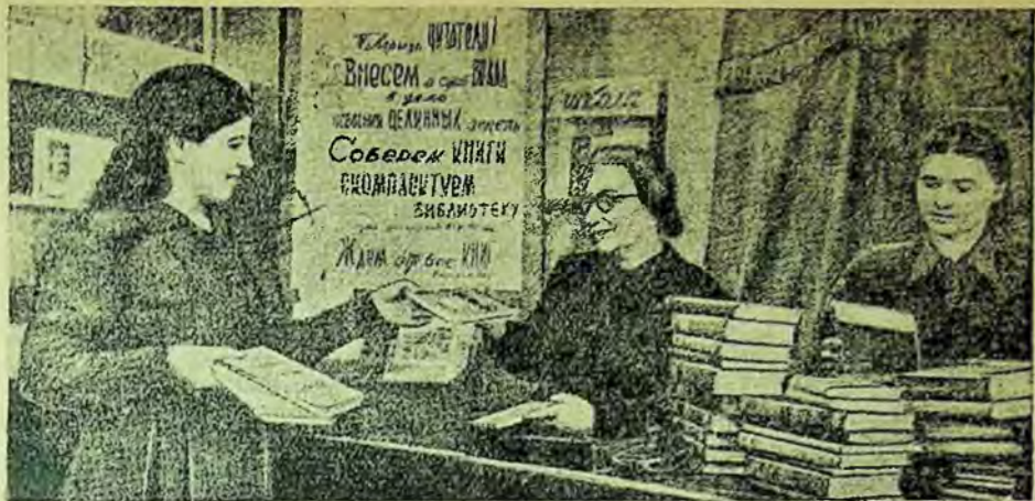
O cititoare donează cărți bibliotecii Nr. 98, din raionul Scerbakov (Moscova), pentru întocmirea bibliotecii ce urmează a fi trimisă în ținutul Altai.

Prin Hotărârea Cabinetului de Miniștri a R.P.D. Coreeană „Despre acordarea de premii celor mai bune opere de literatură clasică cu prilejul celei de a 5-a aniversări a întemeierii R.P.D. Coreene” au fost premiate o serie de opere ce înfățișează patriotismul și eroismul soldaților și ofițerilor armatei populare în lupta dusă împotriva cotropitorilor imperialiști. Astfel, în domeniul poeziei, premiul I a fost acordat culegerii de poezii „Coreea luptă” de Te Ghi Cena, iar premiul II poemului „Cîntecele Coreei” de Min Ben Ghiuna. În domeniul prozei a fost premiat scriitorul Han Sen Ia, pentru romanul „Istoria” și nuvela „Șacalii”, iar premiul II a fost atribuit lui Hvan Ghena pentru nuvela „Fericirea”.