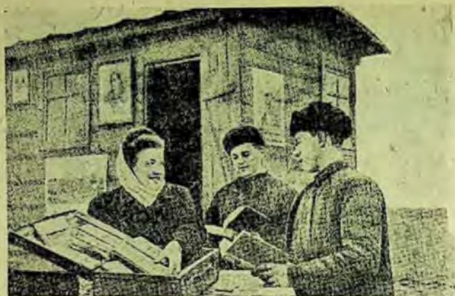
Responsabila bibliotecii din Străjauki deservește cu cărți, la locul de amună, pe tractoriști

Așitkovo. Biblioteca dispune de un fond de 7600 volume, care cuprinde operele clasicilor marxism-leninismului, cărți de literatură agricolă, cărți de științe ale naturii, opere ale clasicilor ruși precum și ale scriitorilor sovietici. Biblioteca numără 756 cititori: colhoznicii satului Așitkovo, muncitorii și funcționarii S.M.T.-ului din Vinogradov, situat pe teritoriul sovietului sătesc. Colectivul S.M.T. din Vinogradov numără 143 muncitori, printre care 3 ingineri, 70 tractoriști, 8 combineri. După Plenara C.C. al P.C.U.S. din septembrie, colectivul S.M.T. s-a mărit cu 50 de muncitori noi.