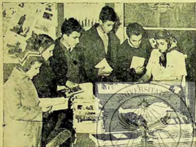
Secția de copii a bibliotecii raionale Cimpina.