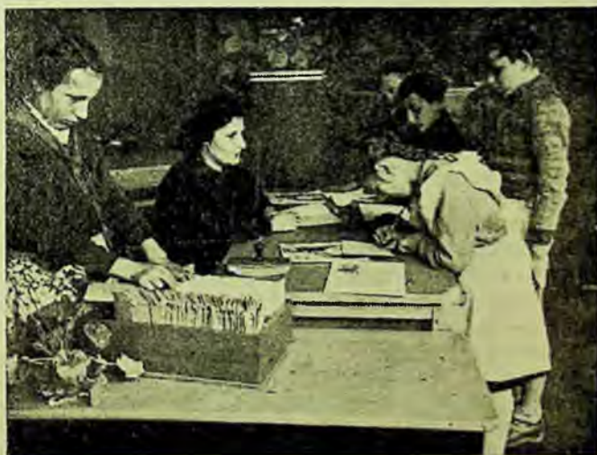
Secția de copii a bibliotecii raionale Botoșani, regiunea Suceava.

Articolul din „Călăuza bibliotecarului” ridică în mod just problema antrenării cititorilor la lectura cărții și a pregătirii lor pentru discuții. Rezolvarea acestei probleme de care depinde în mare măsură reușita unei consfătuiri a pus în fața noastră sarcina de a găsi căile cele mai potrivite pentru ducerea ei la bun sfârșit. În afara faptului că am difuzat toate exemplarele existente în bibliotecă din „Povestire despre Zoia și Șura” pentru a face cunoscută cartea unui cerc cît mai larg, noi am înființat și un cerc de citit în cadrul bibliotecii, condus de responsabilă secției pentru copii. Citirea cărții s-a făcut pe capitole după un plan fixat dinainte. După fiecare ședință au urmat discuții asupra pro-