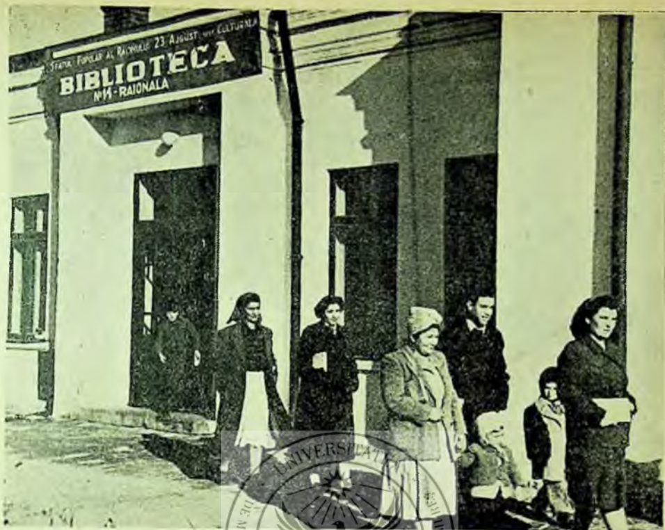
Clădirea bibliotecii Nr. 14 din raionul „23 August” renovată prin grija comitetului de sprijin al bibliotecii