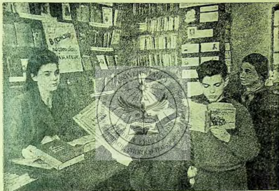
Îndrumarea cititorilor la biblioteca de copii „Usievici” din Moscova

O calitate de valoare a activității bibliotecii „Usievici”, este legătura ei strânsă cu actualitatea și cu cele mai importante probleme ale zilei de azi.