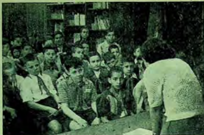
La biblioteca de copii „Arlus“ din București, bibliotecara face copiilor lecturi în limba rusă.

Numărul cititorilor bibliotecii A.R.L.U.S. pentru copii, care astăzi este în medie de 35 pe zi, numărul mare de cărți de literatură sovietică care se difuzează zilnic în bibliotecă și numărul participanților la cercul colectiv de limba rusă ne arată că a-