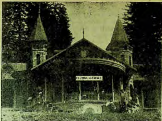
Clubul C. G. M. Nr. 1 din Sinaia

Pentru o cât mai bună desfășurare a muncii în timpul lunilor de vară, s'a hotărât ținerea unor consfătuiri lunare cu bibliotecarii raionali, bibliotecarii cluburilor C.G.M., ai sindicatelor și căminelor culturale, în scopul efectuării unui cât mai larg schimb de experiență și a introducerii de noi metode de popularizare și