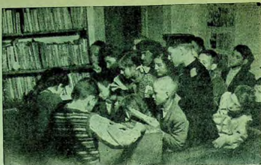
Biblioteca „Grivița Roșie“ a Așezământului Cultural „N. Bălcescu“. Copiii vin la preschimbarea cărților.

schimbă cărțile. Când se strâng la schimbatul cărților mai mulți copii (4-5) de aceeași vârstă, bibliotecara începe să discute cu ei asupra celor citite, care carte le a plăcut mai mult, ce au învățat din ea și ce ar mai vrea să citească. Această metodă este foarte instructivă atât pentru îndrumarea lecturii copiilor, cât și pentru bibliote-