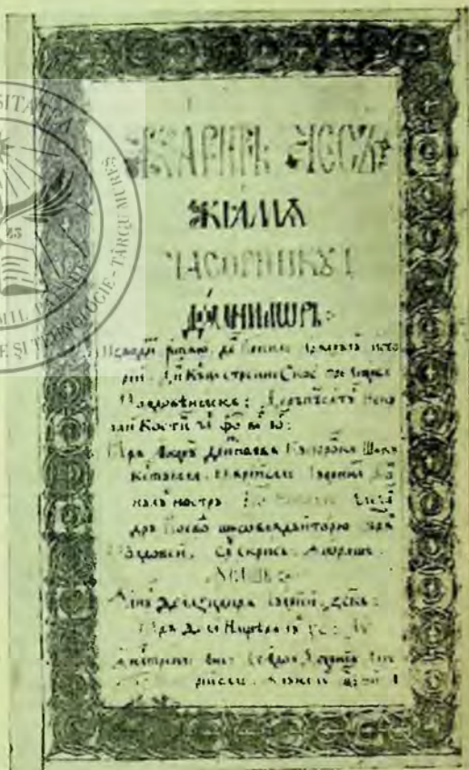
Ceasornicul domnilor (pagină de manuscris) manuscris din 1714.

Secția cuprinde un însemnat număr de manuscrise cu conținut istoric. Voevozii și boerimea au folosit ca mijloc de întărire a pozițiilor lor feudale și letopisetul. Ca cronici autografe se află la Iași părți întregi scrise de mâna lui Neculce (ms. 68,228), cu adnotări ale lui M. Kogălniceanu. În copii caligrafice se găsesc două exemplare (ms 204, 295) din Ceasornicul domnilor în traducerea lui N. Costin. Se știe că această operă a scriitorului spaniol Antonio Guevara se sprijină în bună parte pe aforismele lui Marc Aureliu, care a condamnat orânduirea sclavagistă, ca fiind nedemnă cu sufletul omului. Nicolae Costin traduce cu accentuată energie protestatară, prin 1709, în manuscrisele ieșene citate, discursul rostit în senatul român, de