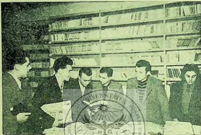
La biblioteca fabricii de postav Buhuși - muncitori sunt îndrumați de bibliotecar asupra cărților politico-sociale

Biblioteca a dat un însemnat ajutor cursului I. C. D. organizat în localitate, punând la dispoziția cursiștilor material ideologic, politic și literar, de care aceștia aveau nevoie, deasemeni, biblioteca a or-