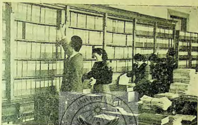
Secția de documentație și bibliografie a bibliotecii Centrale Universitare din Cluj

Nu am putea spune însă, că în munca noastră bibliografică nu există și lacune. Unele tendințe formaliste în alcătuirea bibliografiilor noastre, mai stăruie încă. Spiritul par-