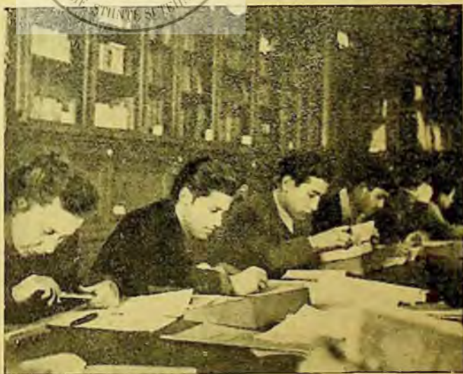
Un aspect al sălii de lectură a bibliotecii centrale Dolj

Pentru a ajuta bibliotecile sătești să și organizeze activitatea lor în timpul iernii, biblioteca regională a întocmit un material cu tema: „Munca culturală în perioada luni-