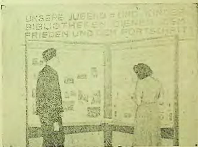
Un panou al expoziției școlii de bibliotecari din Berlin

În mijlocul sălii se afla o carte foarte mare, care, indicând condițiile de înscriere și planul de lecții al școlii bibliotecare, a întregit aspectul