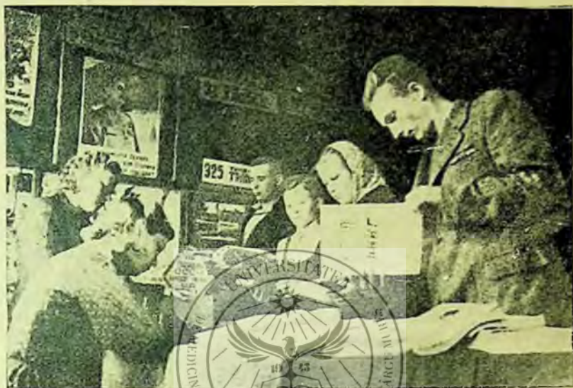
Biblioteca colhoznică din Gordel, regiunea Gorchi. Cititorii cercetează materiale bibliografice despre cartea politică socială

este articolul tovarășei Jdanova. În prezent munca de difuzare a stenogramelor lecțiilor publice este organizată cu mult succes nu numai în bibliotecile raionale ci și în cele sătești. Noile forme de difuzare a stenogramelor conferințelor publice a făcut să crească și interesul cititorilor