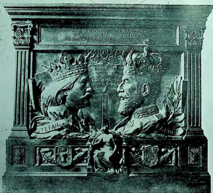
Placă comemorativă, executată de sculptorul Fr. Storck.