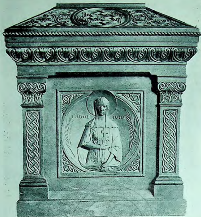
Sarcofag de bronz, executat de sculptorul Fr. Storck.