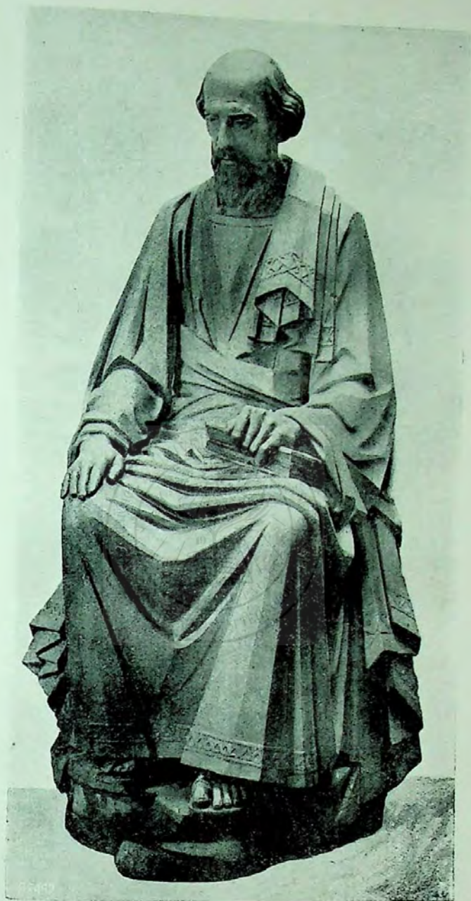
Evangelistal Luca, de sculptorul Fr. Stork.