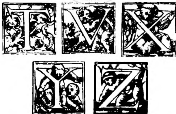
Fig. nr. 8