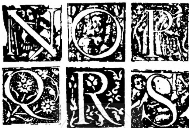
Fig. nr. 7