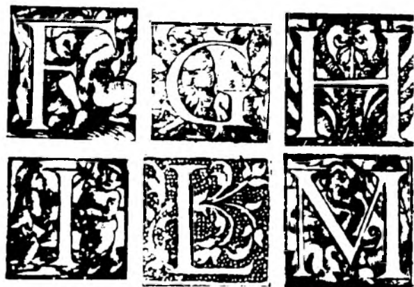
Fig nr 6