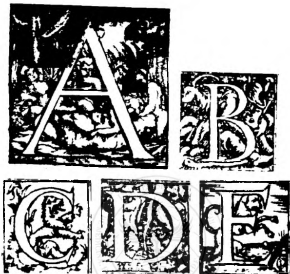
Fig. nr. 5