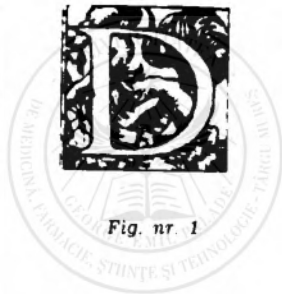
Fig. nr. 1