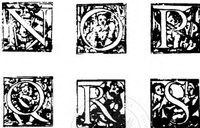
Fig. nr 3