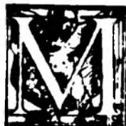
Fig. nr. 2