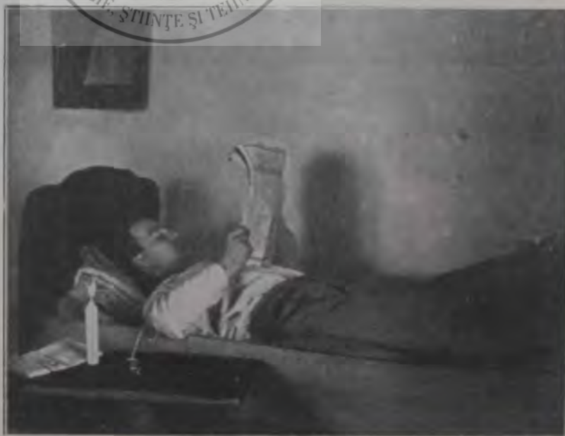
Înainte de a închide ochii, în tranșee.

Theodor Aman născut în Câmpulung , la 1831, este înaintemergătorul lui Grigorescu și primul maestru al picturii românești. Primele studii le-a făcut la București sub conducerea lui Leca și Wallenstein, apoi în Paris, la Picot și Drolling. La Paris a avut mari succese cu „ Bătălia de la Salterino “ expusă la 1856 și cu „ Bătălia de la Olenița “. Abandonând pictura istorică, mai în urmă se ocupă numai de janer (genre). Școala franceză a lăsat adânci urme, ușor de recunoscut, în pictura lui Aman, chiar și acolo unde tratează motive românești. Nouă dintre pânzele lui sunt păstrate în muzeul „ South Kensington “ din Londra, între acestea: „ Odalisca cu perle “, „ Femei din România “, „ Orgia “ etc. Muzeul „ Sinaia “ din București posedă 7, între cari: „ Țiganka “