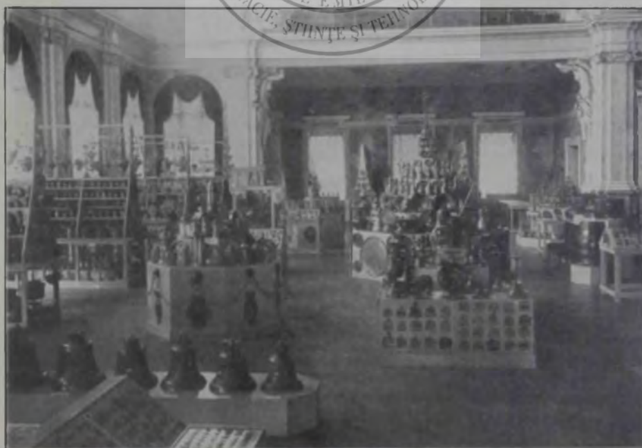
Expoziția metalelor de războiu în Viena.

(La articolul ce se va publica în numărul viitor al revistei noastre.)