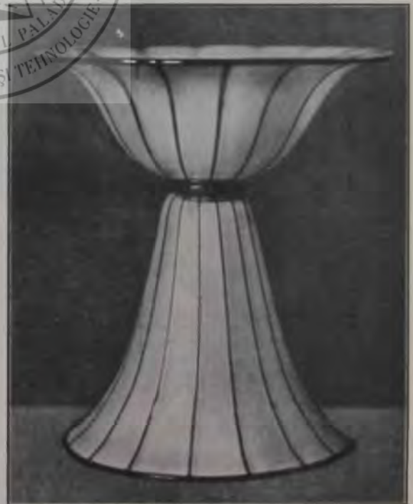
Vas alb albastru. prof. M. Powolny. dela expozițiunea de sticlărie din Viena. (La articolul ce se va publica în Nr. 10—11 al revistei.)