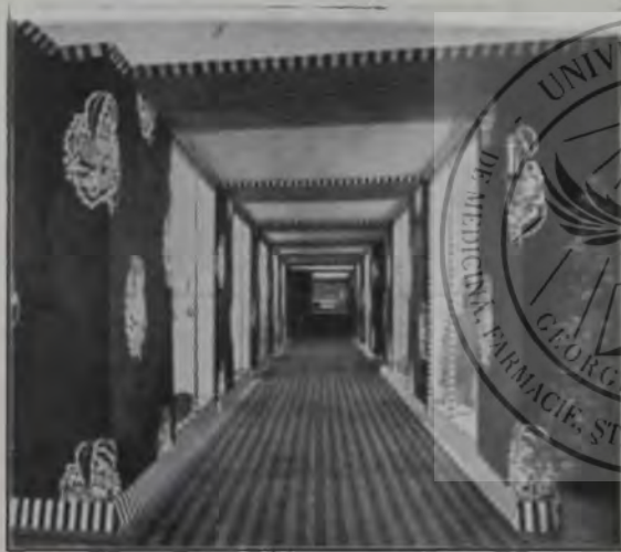
Interior cu vitrine dela expoziția de modă 1916. în Viena de arhitectul Dagobert Pêche.

prea frumoase ornate, potire, feșnice, cădelnițe etc. multe din sec. XIV, chiar, vor fi expuse în muzeul industriei de artă (Österreichisches Museum) în Viena. Am luat parte la desfășurarea și aranjarea materialului artistic sub conducerea prof. Holley și mi-a ră-