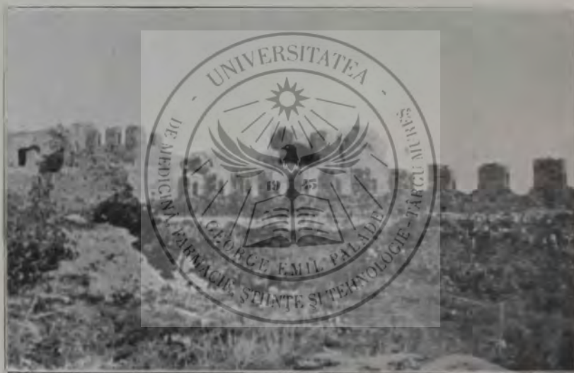
Vechea cetate a Adrianopolului.

Suplirile făceau greutăți, întâi pentru-că nu se găseau candidați pregătiți, al doilea fiind-că bise-