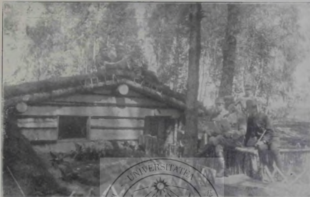
„Pagini Literare“ pe câmpul de luptă