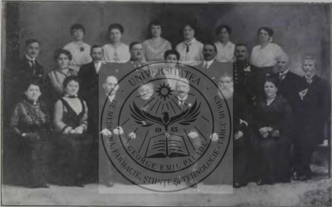
Comitetul de caritate al coloniei române din Viena.