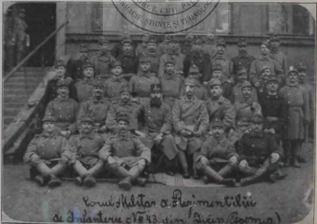
Oficeri și suboficieri rom. ai reg. de inf. 43 în Iliciu.

Voluntarii români reg. 33 și 61 la Paști în Caransebeș.