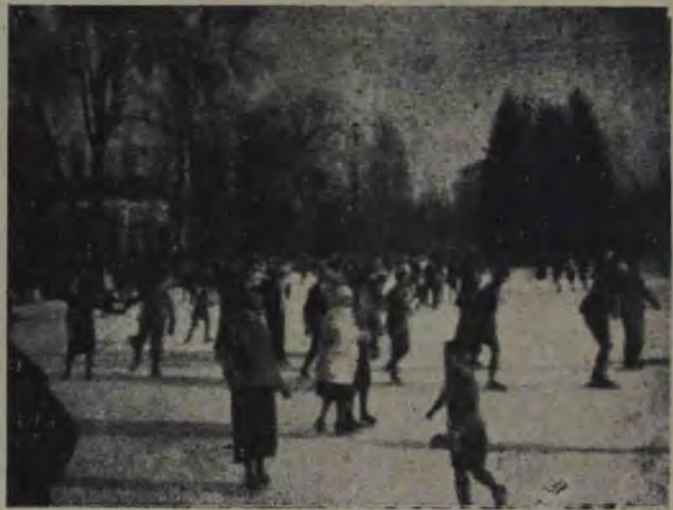
Iarna la Cluj: Lacul de patinaj din parcul oraşului este în zilele de iarnă locul cel mai distractiv din capitala Ardealului, unde sute şi sute de persoane exercită frumosul şi sănătosul sport al patinajului.

— Lasă-mă cu sfaturile Dumitale — răspunse avocatul nervos. Ştiu eu ce să fac.