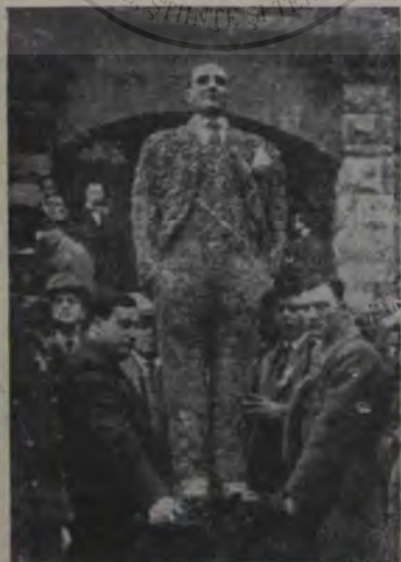
Un mort, care-și însoțește cortegiul funebru.

Colonia italiană din Paris pierzând pe unul dintre cei mai prețioși membrii ai săi, a avut ideea originală de-a face efigia defunctului așa dupăcum se vede aci și a o purta în urma cortegiului mortuar. Capul efigiei este consiruit din ceară, iar corpul din flori naturale.