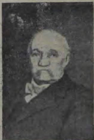
DI ARTHUR EVELYN L... altot de Drul Voronoff la vârsta de 75 de ani.

ășezată în gât, de cele două părți ale mărilor lui Adam.