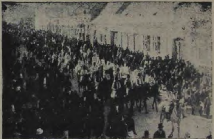
Dela Românil din Serbia: Un bandieriu de călăreți din Vârșet mergând spre gară spre a primi oaspeții, veniți la stînțirea clopotelor dela biserica românească din acest oraș.

— Să nu te căești într-o zi, domnule director!.. și a trântit ușa după sine, cel care totdeauna își păstra sângele rece.