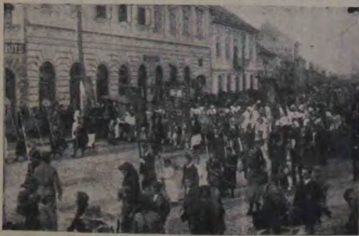
De la Români din Serbia: Procesiunea, cu care s'au dus clopotele cele noi la biserica românească din Vârșej.