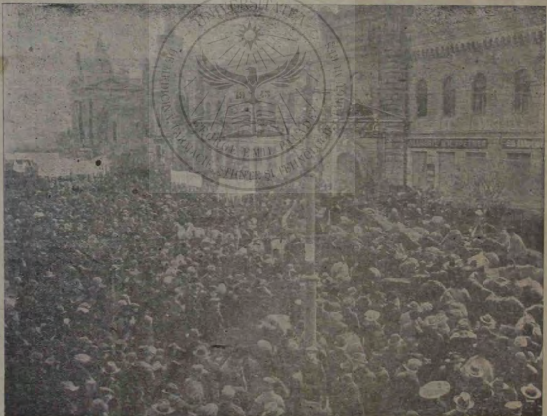
Cererea absurdă a sovietelor de-a admite un plebiscit pentru Basarabia, a stârnit peste tot locul între Nistru și Prut cea mai formidabilă protestare și cu prilejul aniversării alor 6 ani dela unirea acestei provincii, populația ei a ținut să manifesteze în mod demn alipirea sa nestrămutată și credința către țară. Adunările ținute pretutindeni în Basarabia pentru a protesta împotriva absurdelor pretenții rusești, au fost un prilej de rară solemnitate și dovada unui patriotism integru și entuziast. Ilustrația noastră arată demonstrația din orașul Chișinău, la care au participat zeci de mii de oameni.

În timpul acesta bolșevicii din Petersburg: Kamenev, Sijapnikov, Stalin și alții s'au putut pune în egătură cu tovarășii emigrați în