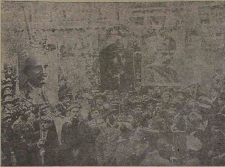
După proclamarea republicii grecești, mulțimea a făcut o manifestație de simpatie pentru oamenii politici, cari au contribuit la proclamarea republicii. Tablourile lor le-au purtat de-alungul străzilor, așa după cum se vede și aci. Aceste tablouri reprezintă dela stânga spre dreapta pe: Papanastasiu, amiralul Hadjikyriacos și generalul Condylis.

Scandinavia, cu cari s'au înțeles să aducă pe Lenin măcar până la granița Finlandei.