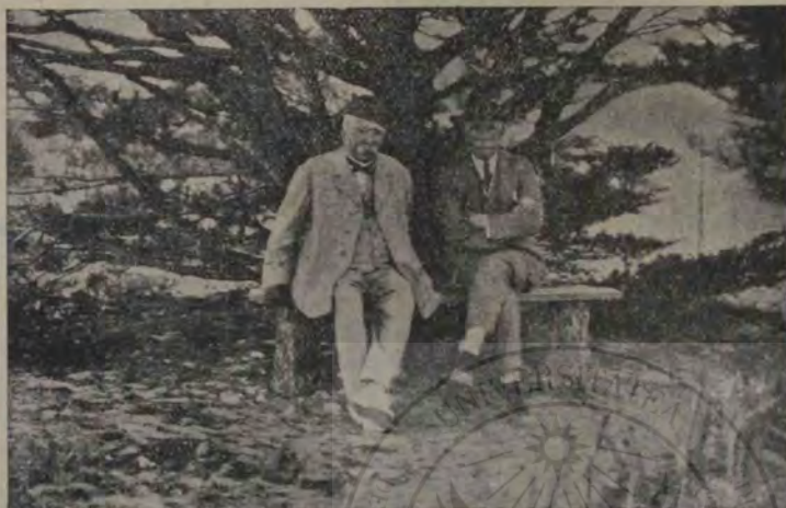
Doi prieteni: Clemenceau, fostul premier francez primind vizita prietenului său colonelul House, la locuința sa de la țară.

Bătrânul Clemenceau alături de amicul său pe o bancă din grădina cu bonetul său bătrânesc, cu mânușile sale de ață, cu mustața sa