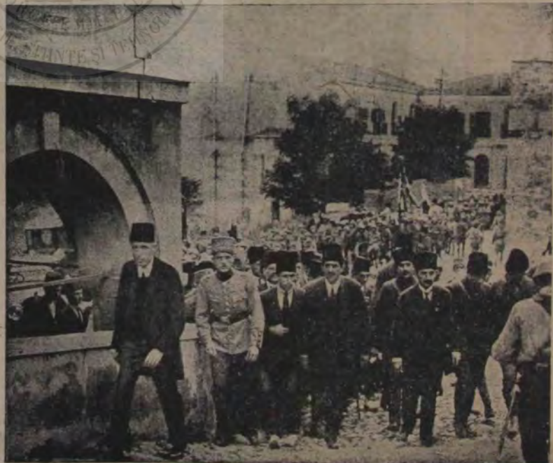
După semnarea păcii dela Lausanne, Ismet pașa a fost primit cu mari ovații în Constantinopol. Instantaneul nostru îl arată mergând la ministerul de externe, în tovărășia mai multor prieteni.

decât vreo mie de persoane. În urmă însă accesul publicului a fost permis și mii de oameni au defilat în jurul catafalcului. A fost o neîntreruptă procesiune până la orele 5 seara, când ușile Capitolului au fost închise și cosciugul transportat la gară. Inmormântarea a avut loc după dorința defunctului la Marion, un orașel în Statul Ohio. Aceasta supremă ceremonie a fost desbrăcată de orice aparat oficial. De prezent președintele Harding, acest om muncitor și drept își doarme somnul de veci în cavoul familiei, o sobră capelă funerară, în vârf cu o cruce, cu întrarea garnisită cu tufe mari de iederă totdeauna verde.