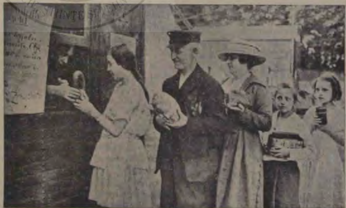
Tragedia mărcii germane: Populația berlineză mergând la spectacole, își scoate biletele de intrare dând în loc de mărci alimente: cărnați, cartofi și altele.

ciar ne mai pomenit a născut și ultimele mișcări anarhice din Germania, care au izbucnit în mai multe orașe, amenințând cu faliment total această țară. Cu toată deprecierea aceasta îngrozitoare a mărcii, statul n'a încetat totuș să scoată mereu