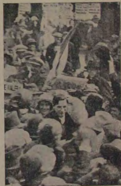
De Valera, agitatorul irlandez la o adunare politică din Ennis, cu câteva clipe mai înainte de a fi prins și arestat.

Ori iată că telegramele ne aduc vestea, că ireductibilul „Președinte al Republicii irlandeze” care ținea un meeting pe piața orașului Ennis în comitatul Clare a fost arestat ca rebel la 15 Aug. c. din partea soldaților din trupele regulate engleze. În panica, ce s'a produs la sosirea trupelor, De Valera a fost trântit pe jos și călcat în picioare. Aproape amețit a fost ridicat de soldați și