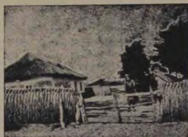
O casă țărănească în comuna Letea

ea se aseamănă cu o cupolă turtită, purtând pe vârf o cruce uriașă — farul insulei. Ancorând în apropiere