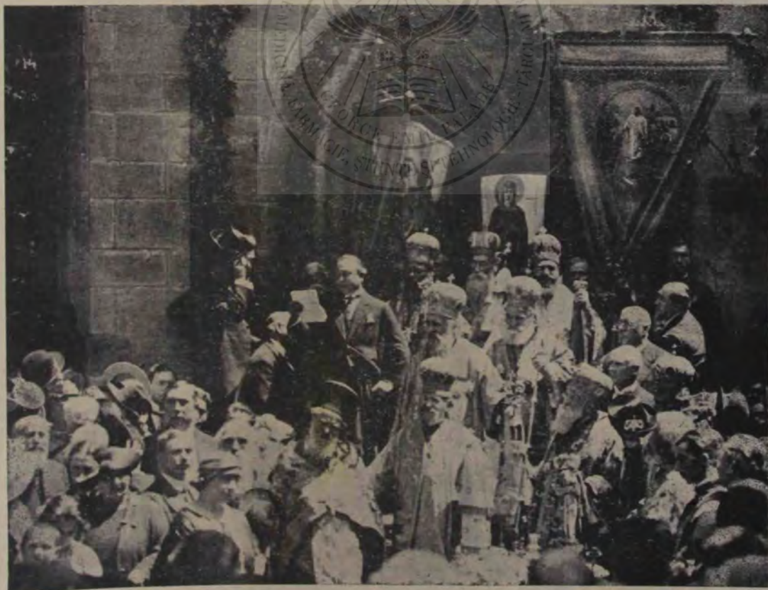
Serbările dela Reșinari: Dl. Octavian Goga rostindu-și la mormântul lui Șaguna splendida cuvântare în numele Academiei române

Vremea era admirabilă și soarele își desfăta razele sale aurii pe albul aprins al cămășilor dela țară.