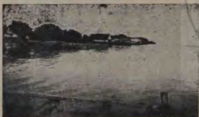
Sf. Gheorghe. Cherhanale la Dunăre

Sulina aci întâlnim pentru întâia dată scumpa noastră Dunăre, palidă la față, de mîlul ce-l poartă spre mare. Părăsind cheiul portului zgotos lăsăm în urma noastră mulțimea vapoarelor de diferite tonaje și ne îndreptăm în sensul curentului spre mijlocul apei. De aici ni se oferă o priveliște de o rară bogăție în forme și culori: în dreapta dealurile Măcinului cu vârful ascuțit îți reamintesc piscurile sălbatic dințate ale Carpaților Meridionali, în stînga malul basarabean în formă de plaje se înbină cu orizontul și la mijloc Dunărea își rostogolește încontinuu masa galbui. Privind de pe vapor suprafața apei, te prinde un fel de somnolență, care te face să vezi ca printr'un păianjeniș malurile acum măi îndepărtate. Conturul fluviului e precizat de șireagul fără sfârșit al salciilor, care se chiorăsc somnoros în oglinda apei. Identitatea peisajului se continuă și cum totul în natură se prezintă în dimensiuni uriașe, te prinde un fel de sfială. Din când în când apare câte o roată gigantică, ce scoate apa Dunării pentru irigația terenurilor de horticultură, sau ne oprim la vr'un port micuț. Lăsând în urmă portul Reni de pe malul stîng, — odinioară centru de gravitație al produselor Basarabiei, — spre dreapta