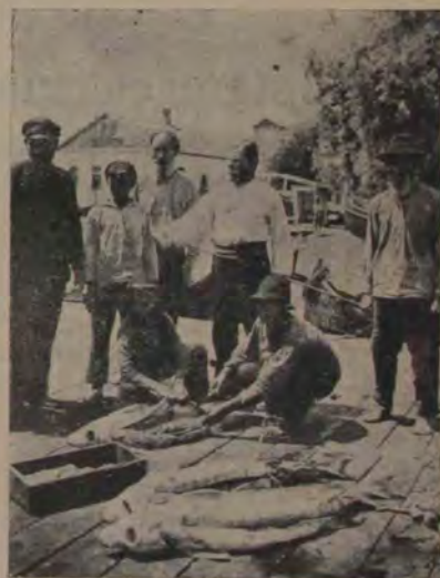
Vălcov. Scoaterea icrelor din nisetri

— canal natural, — care leagă ghiolurile cu apa Dunării, sau se pierde în adâncimea stufăriilor. Mai târziu îți fixează atenția un șireag de case aliniate în lungul Dunării. Figuri curioase — între cari descoperim un preot venerabil — ne privesc de pe mal. Fără să vrem ne punem cu toții întrebarea, ce se face oare un intelectual izolat de lume în regiunea aceasta a apelor?... Am ajuns la Cianurolia, dar trecem înainte fără oprire.