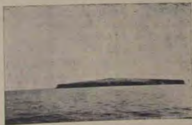
Insula Șerpilor, din depărtare. Vedere spre E.

Urmând ca dela Sulina, — cartierul nostru general — să facem câteva excursiuni prin împrejurimi, prima noastră țintă e vizitarea bă-