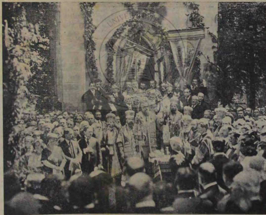
Serbările dela Reșinari

REVISTA · ILUSTRATA · INTEMELIATA IN · 1911 · APARE · LA · 10 · SI · 25 · ALE FIECAREI · LVNI · DIRECTOR : SEBASTIAN · BORNEMISA