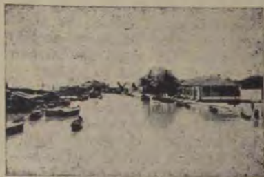
Vâlcov. Canalul Belgarsky

apele Deltei, se pare un avanpost înaintat de omenime spre întinsele pustiuri ale mării. Pe Dunăre cir-