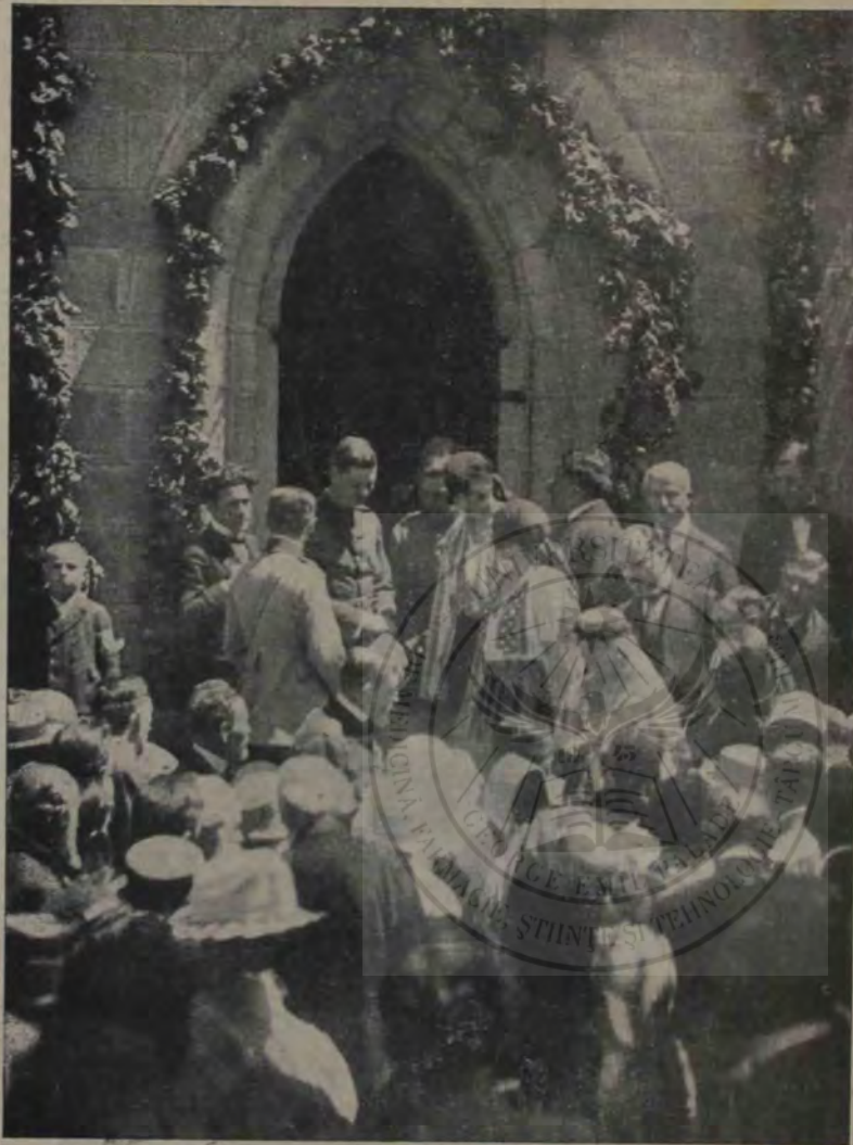
Serbările dela Reșinari: Familia domnitoare vizitând mauzoleul lui Șaguna

Clișeele noastre din numărul de față reprezintă scene luate la fața locului în comuna Rășinari.