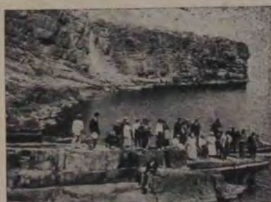
Grupul excursioniștilor Institutului de Geografie din Cluj la Insula Șerpilor.

De altfel puțină viață e pe această insulă. Ea poartă mai mult nota singurătății și a pustiului. Plantarea de pomi din primăvara aceasta n'a reușit, iar iarba s'a ars de timpuriu, încât cele câteva oi observate în umbra farului, o duc rău de tot.