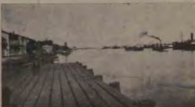
Cheiul Sulinei și vapoare pe canal