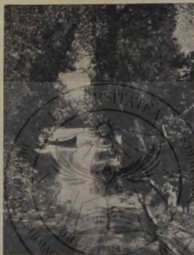
Vâlcov. Un canal

Intrând în gârlă, — care șerpuieste capricios prin desimea stufului, îngustându-se la 2—3 m. ca apoi să se lărgască — calea noastră e presărată de nuferi argintii. Se pare, că te adâncești într-o pădure compusă din aceleași esențe, dar pădurea aceasta nu mai are sfârșit. E numai stuf și apă. În imperiul acesta domnește o liniște neînchipuit de profundă și care te apasă pe suflet. Deodată de o mică adiere trestia începe un legănat ușor, apoi face