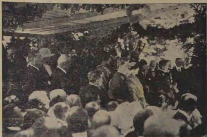
Serbările dela Reşinari: Logea familiei regale, în care iau parte fruntaşii politici ai ţării