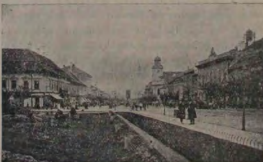
Str. Regina Maria cu primăria orașului