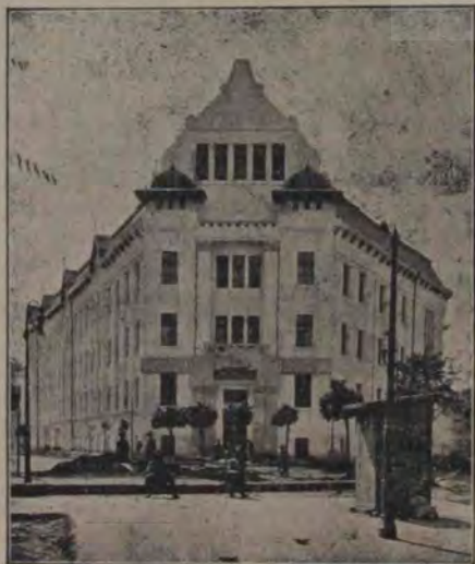
Școala comercială ungurească din Târgu Mureș, pe care a luat-o deunăzi statul român, fiind zidirea făcută cu cheltuiala statului ungur de pe vremuri.

Ascultați! Ca să dezmiere, Primăvara are magi Cântăreți de cânturi dragi; Ciripiri, cerești descânturi,