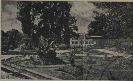
O parte a parcului