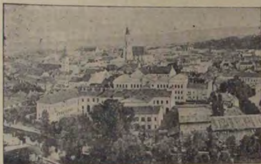
Vederea generală a orașului Cluj