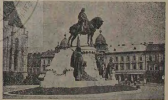
Statuia lui Matei Corvinul, în dosul căreia se află palatele statusului rom. cat.