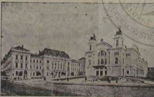
Teatrul Național și palatul justiției