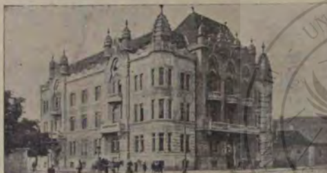
Camera de comerț și Industrie