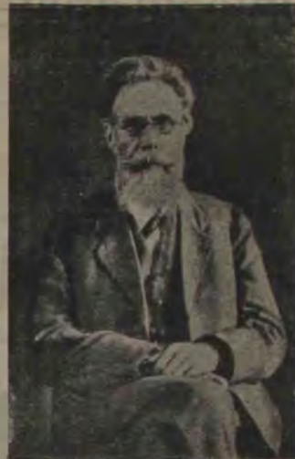
Prof. Roentgen 'mort nu de mult,

Răsfrângerea razelor pe placă în aceste condiții a apărut ca o proprietate nouă a sării de uranium, pe care Becquerel a numit-o radioactivitate (1896).