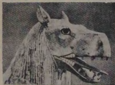
Capul unui animal care împodobește un pat regal de-al lui Tut-Ankh-Amen.