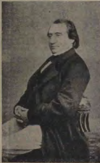
Renan, la vârsta de 41 de ani, după ce a publicat monumentală sa carte: „Viața lui Isus.”

La 32 de ani Academia de inscripții și arte frumoase i-a oferit