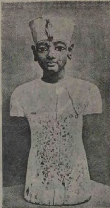
Un manequin, pe care regele Tut-Ankh-Amen își ținea tunicele sale. Se crede, că înfățișarea lui este cea a faraonului vestit.