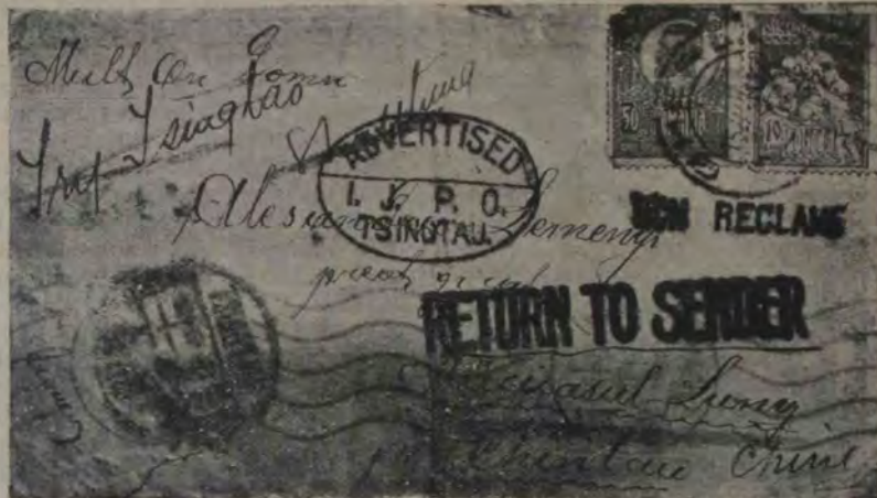
Adresa unei scrisori, pe care posta română în loc din Chintău, lângă Cluj, a expedit-o în orașul Tsingtau din China.

soarea în Ungaria cu indicația: Londă-at at Gyöngyös, adică Londó pe pusta dela Gyöngyös, dând o strașnică lecție de geografie și conștiință în serviciu funcționarilor unguri.