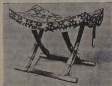
Un scăunel încruntat cu os de elefant.