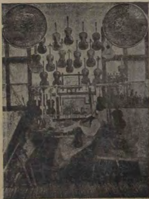
Maestrul de vioare Chitta, în atelierul său.