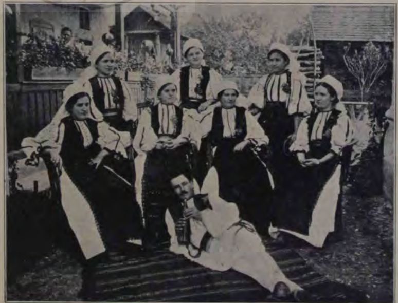
Diletanții-teatraliști din Aiud, cari s'au produs la petrecerea ultimă.

— Păi, cică holera. Un domn se ținea de stomac când îl puneau în