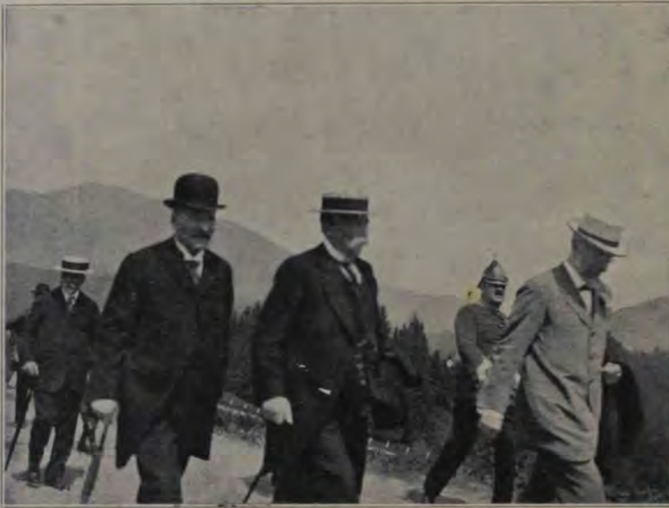
Delegații statelor din Balcani după încheierea păcii la București au făcut o excursie pe valea Timișului, ca să vadă frumșetele României. Ilustrația noastră arată pe delegați la granița română-ungară, pe șosea.

trifugă, el zboară cu bicicleta sau automobilul deasupra golului, căzând apoi ca fulgerul pe cărarea de fer. Promotorul acestui exercițiu a fost americanul James Smithson din San-Francisco. De la el încoace, nenumărați au fost aceia cari au executat teribilul „looping the loop”. O englezoaică, Mies Kent a inventat un exercițiu inedit. Ea a pus să i se construiască o țevă de tun în care intră și cu ajutorul unui resort puternic eră lansată în aer pe o distanță de 15 metri, după care cădea pe o plasă construită spre a-i amorți căderea.