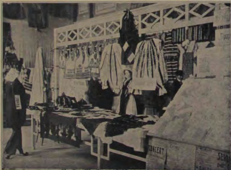
Vedere din expoziția din Orăștie.

A sări în apă e însă mai puțin primejdios decât a sări tot în fuga vertegioasă a automobilului sau a bicicletei de pe un loc pe altul, ceea ce constituie faimosul „looping the loop”. De pe o trambulină înaltă de 10 metri se scoboară o cărare de 2 metri de lățime în formă de semicerc formând un diametru de 7 metri. Dar la un punct al ei conferința se întrerupe pe o distanță de 12 metri, după care se continuă. Acrobatul parcurge în fuga vehiculului cercul, ajunge la locul unde se întrerupe și dus de puterea cen-