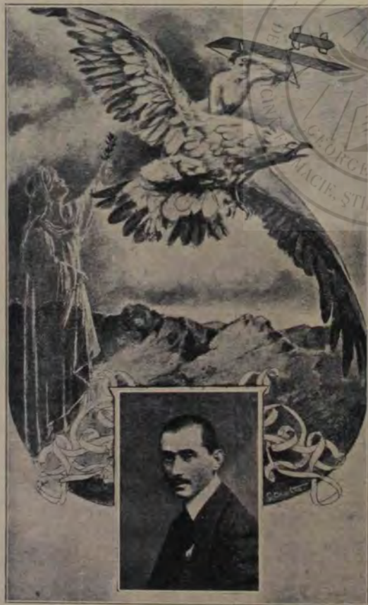
Visul lui Vlaicu... Frumosul lui vis de-a trece Carpații, — zugrăvit pe ilustrate făcute la București îndată după nenorocita lui cădere.

Nu e însă vreme pentru recriminări zadarnice.