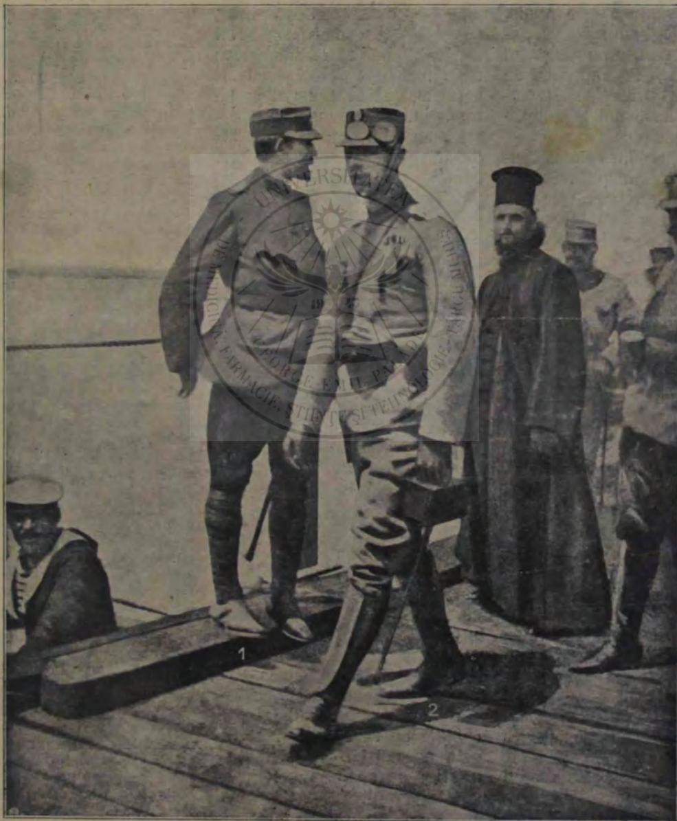
Podul de pontoane la Corabia, trecut ca de cei dintâi de Alteța Sa Principele Ferdinand, (1) generalissimul armatei de operațiuni și de fiitul său Prințul Carol (2), urmați de un preot dela curte și de suita ofițerilor — la 14 Iulie n. 1913.