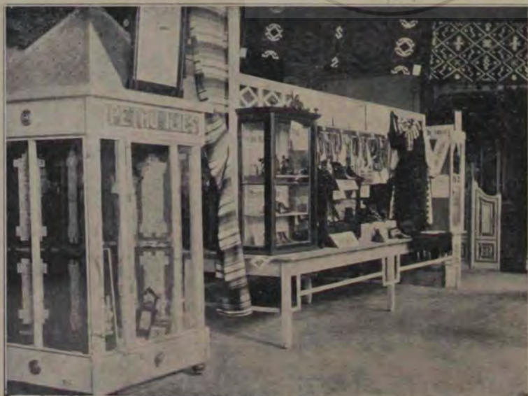
Vedere din expoziția dela Orăștie, aranjată de Reuniunea meseriașilor și Atelierul de țesături.

A patra și a cincia zi, de holeră nici nu se mai pomenește. Valurile