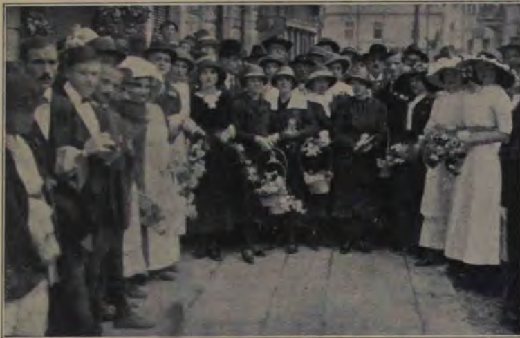
Dela serbările Asociațiunii în Orăștie : Domnișoarele cari au vândut flori în prima zi a serbărilor, în favorul Asociațiunii. Din vinderea acestor flori s'au adunat cam 300 coroane.

ciare ale Parisului — și este de prevăzut, că multă vreme încă rugămintea lor nu va fi ascultată.