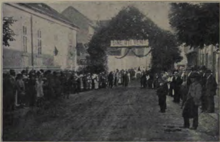
Dela serbările Asociațiunii în Orăștie: Așteptarea oaspeților înaintea portalului, sâmbătă, când a sosit comitetul central din Sibiu.

Bulgaria să nu aștepte nici un ban din partea Franței”.