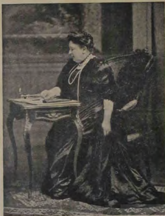
Principesa Maria din Belgia, contesă de Flandra, mama regelui Belgiei și sora regelui Carol I. al României. A răposat în 26 Noembrie în Brüssel.

teă operă cu ele la încercări. Se zice, că de un timp încoaci dna Curie ar încerca rezolvirea cu cantități mai mărișoare de poloniu. Fel și fel de motive ponderoase însă ne determină a susține, că produsul final al disocierii radiului ar fi un element neactiv și anume plumbul . Între altele e de exemplu faptul, că în mineralele ce conțin radium, se află totdeauna și plumb și că raportul între cantitatea de radium și de plumb, ce se află în acelaș timp într'un mineral, e cam acelaș.