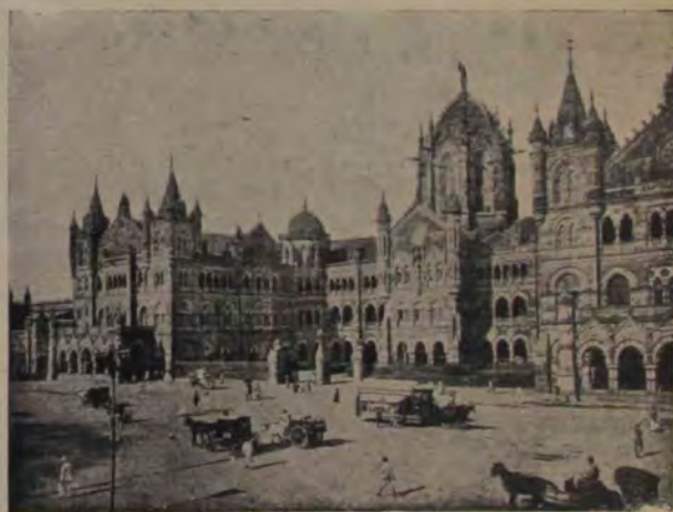
Vedere din orașul Bombay: Casa orașului. Civilizația engleză, care paralel cu stăpânirea Angliei a străbătut și ea pretutindeni în India, a făcut din unele orașe de pe-aici adevărate orașe moderne europene. Așa e între altele orașul Bombay, pe care-l împodobesc nu numai străzi îngrijite ci și palate cu 3-4 etaje.