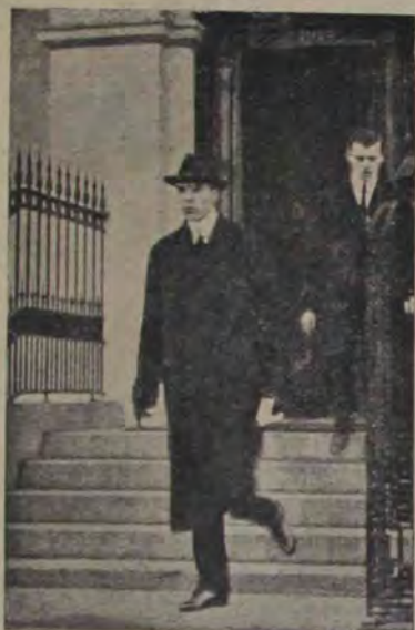
William Vincent Astor, băiatul milionarului Astor, care s-a înecat la peira Titanicului. Tânărul Astor e unul dintre cei mai bogați oameni din lume și a moștenit după tatăl său 425 milioane.

Chiar și numele lor ne spune, că ei sunt atomii electricității și că prin urmare astăzi electricitatea se consideră ca ceva material. Electronii sunt încărcările electrice cele mai mici, a căror existență s'a dovedit. Dimpotrivă particulele razelor-alfa , cari încă sunt electrice, sunt atomii gazului numit helium , căruia i-s'a dat de urmă mai întâi în soare, înainte de a fi fost aflat pe pământ.