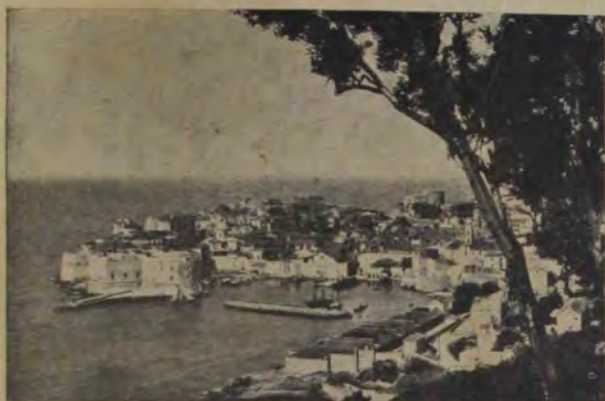
Vedere din Ragusa, oraș pe țărmul Dalmației. Ragusa are 7000 până în 8000 locuitori și aparține din 1814 Austriei.