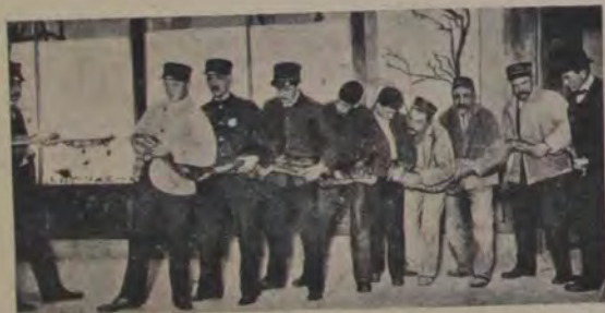
Nutrire forțată a unui șarpe uriaș într'o grădină zoologică. Șerpii aceștia ajunși odată în robie, refuză să mănăce câte 6-8 luni, așa că de multe ori trebuie stăpânul să se îngrijască de o nutrire forțată a lor. Aci se vede un astfel de șarpe uriaș, ținut de 9 oameni, iar unul îi bagă mâncarea.

Cred că nu mi-au trebuit mai mult de cincisprezece până la douăzeci de minute dela Drachenburg până sus în vârf.