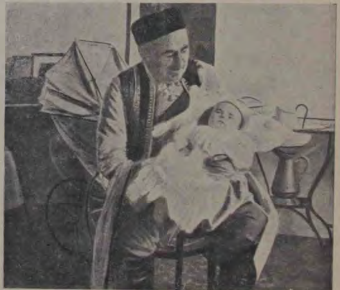
Nichita, regele Muntenegrului, legănându-şi în clipe de repaos nepoţelul, pe principete Mihail.