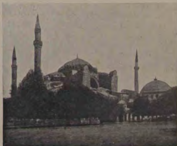
Sfnta Sofia, renumita biserică creștină în stil bizantin, pe care Turcii la ocuparea Constantinopolului au prefăcut-o geamie.