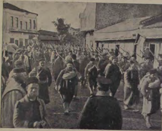
Trupe bulgare mergând spre Adrianopol.