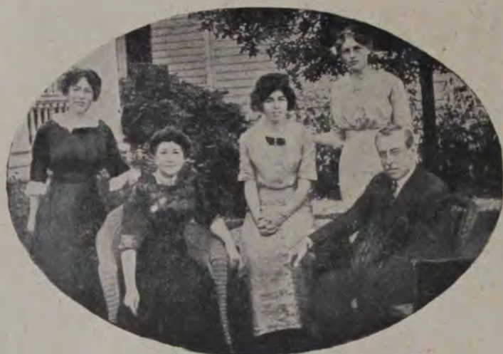
Wilson, noul președinte al Statelor-unițe împreună cu familia sa. Wilson a fost ales președinte față de Roosevelt și Taft cu o majoritate considerabilă.