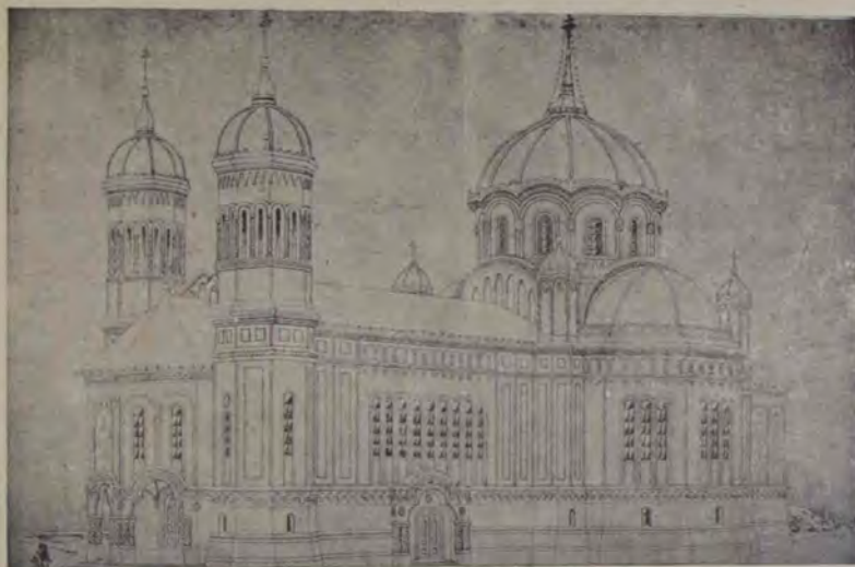
Planul Bisericii gr.-or. române din Orăștie. Desemn de Dușoiu & Leucă.

zilele. El pășea larg și repede, dar tot nu-l putea ajunge pe Petru Brad. În urmă acesta îl auzi, se opri cutremurat, căci cunoscuse vocea.