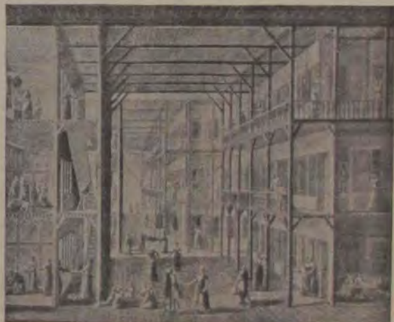
Interiorul unui harem din veacul al 17-lea.