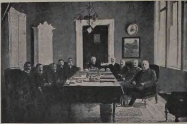
Sfatul miniştrilor bulgari, cari au declarat războiul cu Turcia.