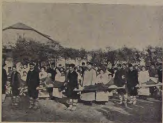
Sosirea în Sofia a unui transport de răniți Bulgari de pe câmpul de luptă.

care vrea să biruiească fie în luptele politice, fie în bătaie cu arma. Documentează foarte clar că solidaritatea nu-i decât latura politică a unității culturale. Fără comunitatea de idei, sentimente și ideale, — cari toate izvorăsc din unitatea culturală a unui popor — nu poate fi nici vorbă de solidaritate în marile acțiuni naționale. Pentru aceasta activitatea culturală trebuie să premerge activității politice; pentru aceea trebuiesc sprijinite mai ales operele culturale din cari primește acelaș nutremânt un popor întreg. El sfârși: „Spun acestea, dragii mei, din convingerea cea mai adâncă. Orice operă de artă care se adresează sufletului unui întreg popor, e cel mai de preț dar ce se aduce din partea celor aleși pentru consolidarea unui neam, pentru asigurarea biruințelor lui viitoare. Oricare nou artist înseamnă un pas mai departe pe drumul învingerilor naționale“.