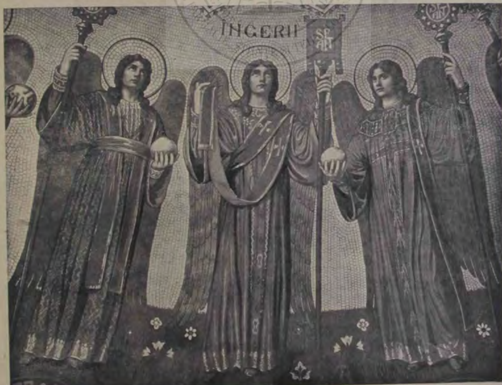
Îngeri pictați în catedrala din Sibiu de răposatul Octavian Smigelschi.