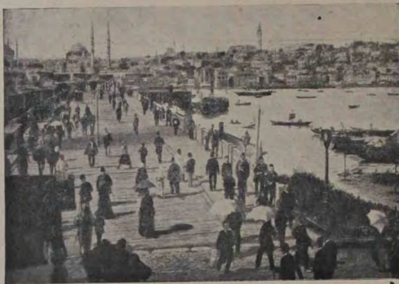
Vedere din Constantinopol amenințat a fi cucerit de armatele glorioase ale Bulgarilor. Chipul nostru arată podul cel mare peste Cornul de aur, pe care se preumblă lumea în clipe de repaos.

Românul nu știa cum să înceapă. Par'că îl străngea ceva de gât.