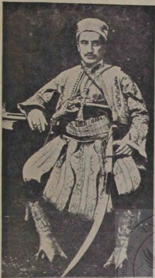
Bolietinaț Issa, vestitul bandit albanez, care la izbucnirea războiului din Balcani s-a dat pe partea Bulgarilor, de fapt însă ținea cu Turcii. Fiind descoperit, a fost împușcat de Bulgari.