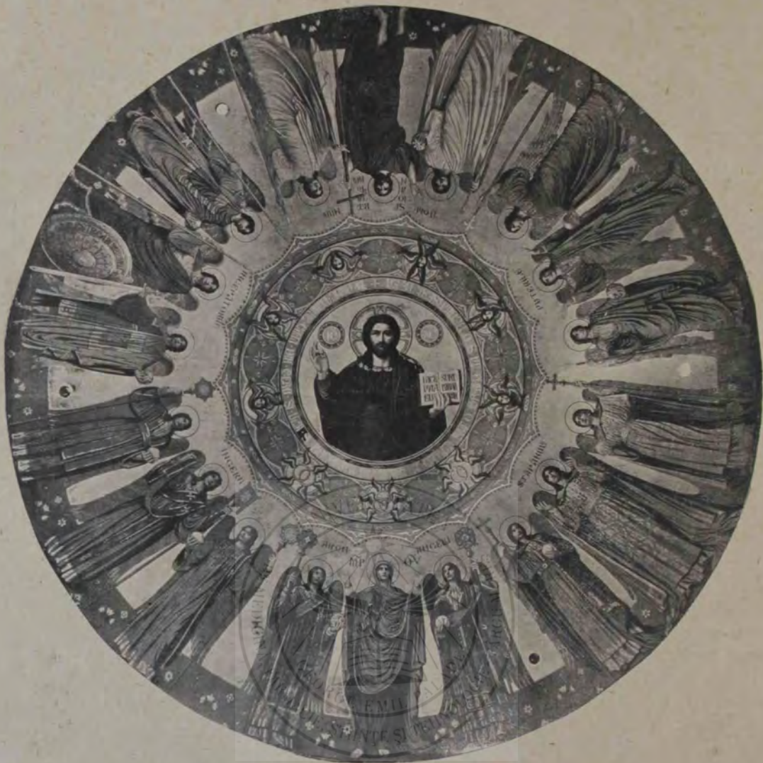
Pictura de pe cupola catedralei din Sibiu de răposatul Octavian Smigelschi.

popa din sat, nu mai încetă a stării pe lângă bădicul Ilie să-și dea copilul la școală la oraș.