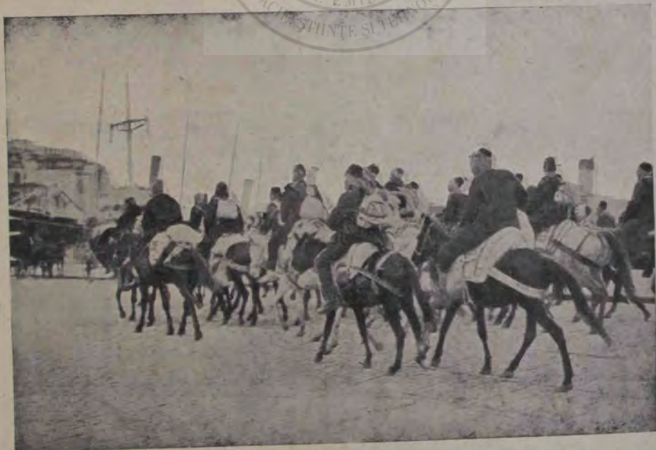
Turcia în urma luptelor ce le-a pierdut aproape pe toată linia față de popoarele balcanice, e amenințată să-și piardă toată stăpânirea în Europa, și în fața primejdiei ea a chemat sub arme chiar și pe glotașii țării. Chipul nostru arată o grupă de glotași, cari sosesc în Constantinopol, ca să fie apoi trimiși pe câmpul de luptă.

— Azi l-am năcăjit, îmi spunea prietinel hazliu. Și nu știu cum, în sufletul meu se petrecea o revoltă neînchipuit de mare. Par'că vedeam fruntea lui posomorându-se, par'că-l vedeam cât îi pare de rău că situația materială nu-i permite să se retragă de orice