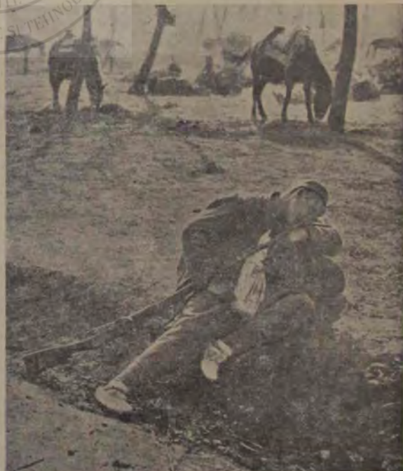
Un soldat bulgar învingător odihnindu-se pe pământul cucerit. Doarme pentru întâia oară pe glia luată dela dușman.

Dacă noi oamenii am fi înzestrați cu un simț, care ar reacga față de electricitate întocmai cum reacgează ochiul față de lumină, ne-am putea orienta cu ajutorul unui astfel de organ admirabil în lumea imensă a corpurilor noaptea tot atât de bine, ca și ziua. Lumea însă, pe care am percepe-o în cazul acesta, ar fi de tot alta.