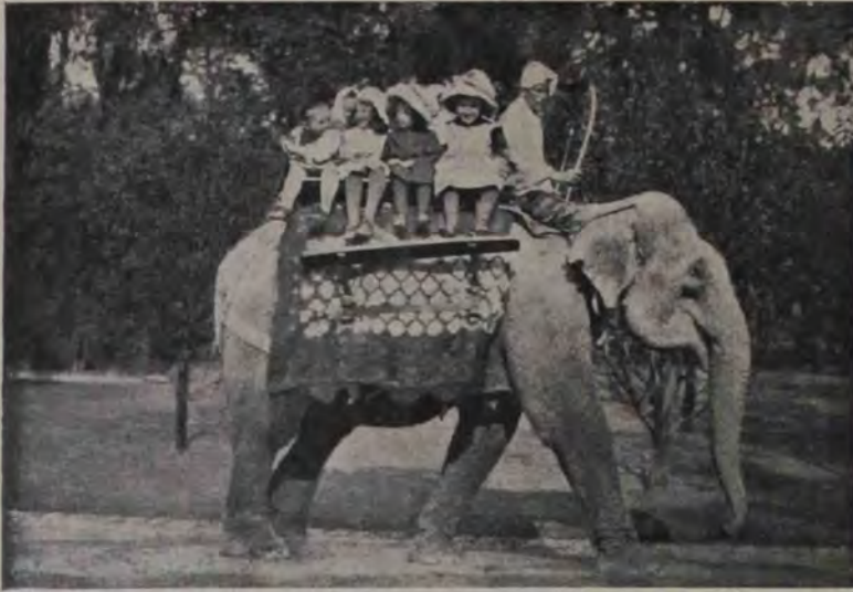
Un elefant îmblânzit, care duce pe spate o droaie de băeți. E elefantul din grădina zoologică din Budapesta.

pricina sănătății ei șubrede, se îngrozise, firește, la gândul unei nunți în casa ei, și răspunsese într'un chip nu tocmai mulțumitor. Hotărîrăm apoi să primim găzduirea prietinoasă a prea bunilor soți Steele, cu condiția însă, să grăbim cât mai mult cu putință ziua nunții. Eu nu cunoșteam legislația prusiană, în ceea-ce privește căsătoria streinilor, nu știam adică ce formalități trebuiau îndeplinite și de ce hârtii aveam să am nevoie. Nici chiar domnul Steele, căruia i-am vorbit numai decât de lucrul acesta, nu știă ce trebuie să fac. Atunci mi-a venit în gând că s'ar putea la Rüdeshheim să facem numai cununia religioasă, iar pe cea civilă s-o facem în Italia.