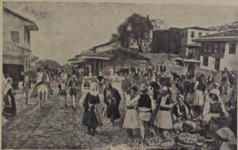
Vedere din Albania: Zi de târg în orașul Scutari.