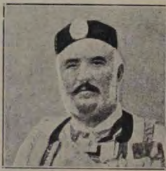
NICHITA, regele Muntenegrului.

cohortă de însușiri sufletești: voință, atenție, judecată simțire. Cine a avut cinstea să stea câteva ceasuri în societatea dlui Iorga, a putut să observe, că omul acesta nu e un vizionar care trăește din „intuiții” gratuite și din revelații venite pe cale misterioasă, ci e un mare suflet atent care vede, observă, cercetează, judecă și verifică. Sunt sigur că dl Iorga are un întreg sistem de filozofie bazat numai pe observația zilnică a lucrurilor din curtea care înconjoară casa d-sale.