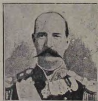
GEORGE, regele Greciei.