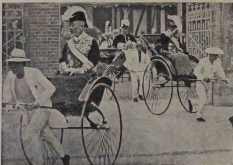
Magnați japonezi rentorcându-se dela deschiderea parlamentului, în trăsurile lor trase de servitori.

Cucoana: S-ar fi găsit, de asta să nu te îngrijești d-ta! M-au iubit pe mine oameni mai ceva ca tine!