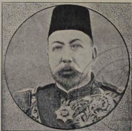
MEHEMED RESHAD V. sultanul Turciei.