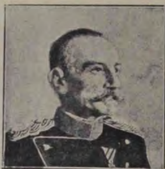
PETRU, regele Sârbiei.