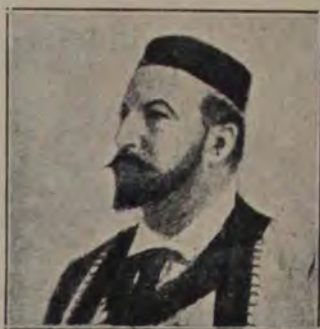
FERDINAND, regele Bulgariei.