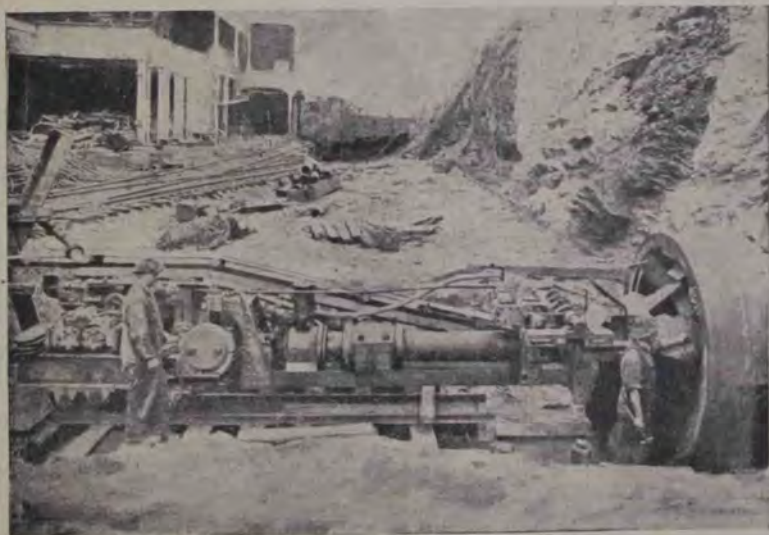
Mașină modernă pentru sfredelirea munților, prin cari se fac tunele. Mai nou în Newyork cu această mașină se fac toate tunelele orașului, și are marele avantaj că se lucrează cu ea mai repede și mai bine, că cu cele de până acum. Mașina aceasta sfredelște pe oră o gaură de 1 metru de lungă și 3 m. de largă.

Să luăm acum noțiunea unui bilion (un milion de milioane, sau o mie de miliarde), adică a numărului, ce se scrie cu un unu și cu doisprezece zero după el. Mărimea grozavă a acestui număr reiese din exemplul următor. Dacă am voi să numărăm un bilion de coroane, admițând că ar exista atâtea coroane, a-