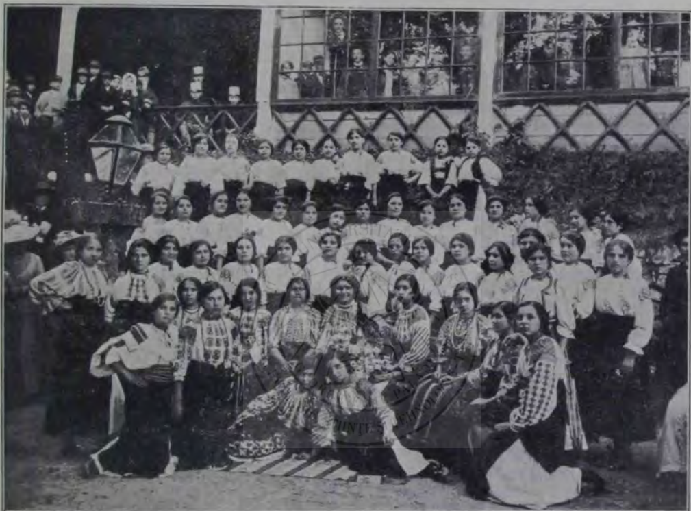
Internatul-orfelinat al „Reuniunii femeilor române din Brașov”, la congresul femeilor române din Ungaria, ținut în Brașov.

A!... Ridicole! Țsta e adevărul, pentru care am răs! Peșitul lui Crăciun s'a sfârșit ridicol! Cum ne vine uneori în minte expresia potrivită, când nici nu ne gândim la ea, nu-i așa domnule Murășanu? Cât m'am gândit eu să aflu un termen potrivit pentru faptul care m'a îndemnat la răs, și iată-l. Ridicol!