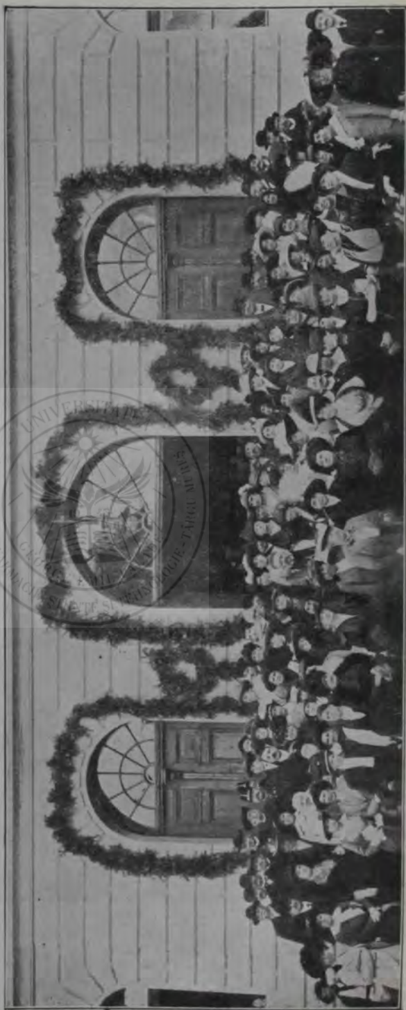
Congresul reunitiilor române de femei din Ungaria: Participanții ieșind dela congresul ținut în sala festivă a gimnaziului român din Brașov.

Dumneata vei fi așa de bun, ca luând în dreaptă culpă-nire toate acestea, să-mi tri-