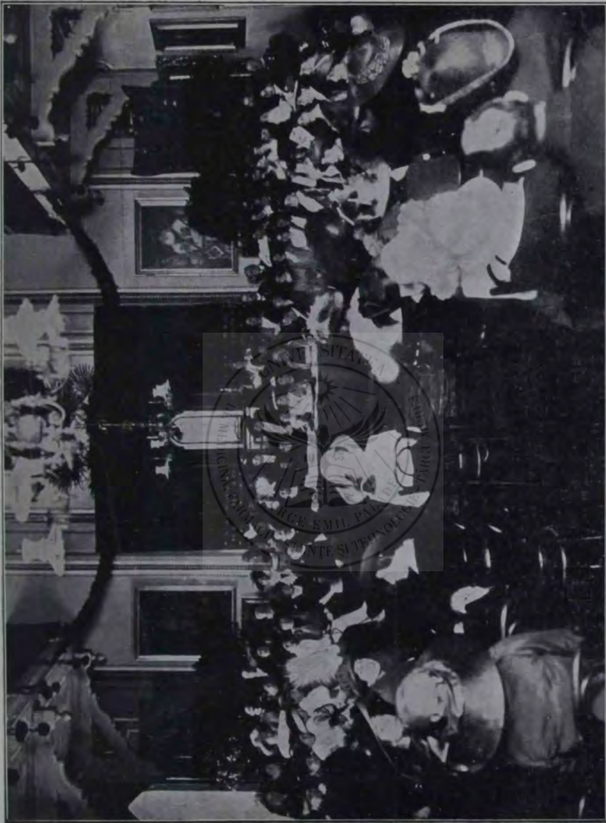
Congresul reuniunilor române de femei din Ungaria, ședința a doua ținută la 4/17 Iunie 1913, în sala festivă a gimnaziului român din Brașov.

patru ochi, căci tata l-a dat afară numai decăt. Eu am înțeles îndată ce s'a întâmplat, am priceput mai repede ca oricare, și m'a