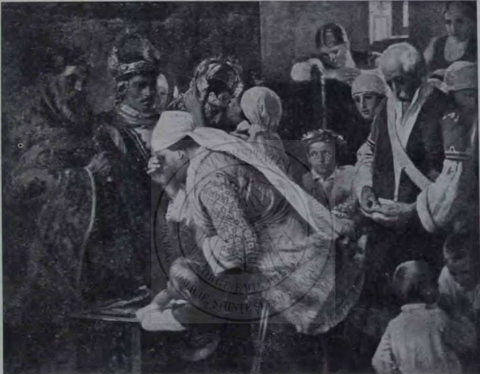
I. Mărkvicka: Nuntă țărănească bulgară.

„De-aia-mi place mie țigara groasă la drum. O'aprinzi aici și ține până'n Deleni,” zise lerotei, întorcându-și peste umăr fața brăz-