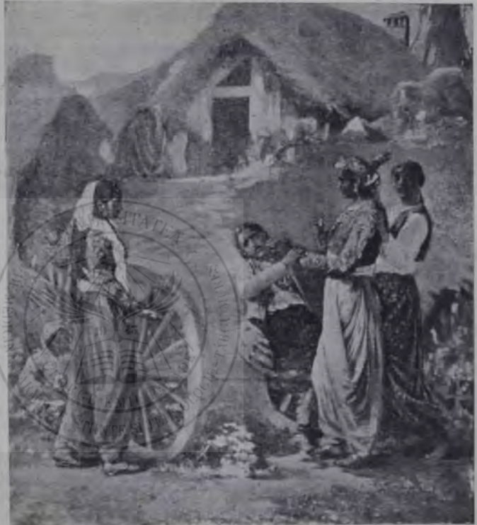
I. Mărkvicka: Țigănci.

adevărul. Îmbracă din nou paltonul. Adieri răcoroase se prelingeau și deoparte și de alta din pădure ca niște ape subțiri nevăzute. Ca niște colonne albe, rotunde, puternice, se înălțau fagii bătrâni pe coastele țepișe de amândouă părțile drumului. Creștetul lor se zăreă deoparte în înălțimi, erau fagi aproape drepți ca brazii, fără crengi, numai deasupra cu o coroană puternică. Soarele le lumină creștetele, pe alocuri lumina puneă pete mari albe și mai în jos pe trunchiu, dar drumul