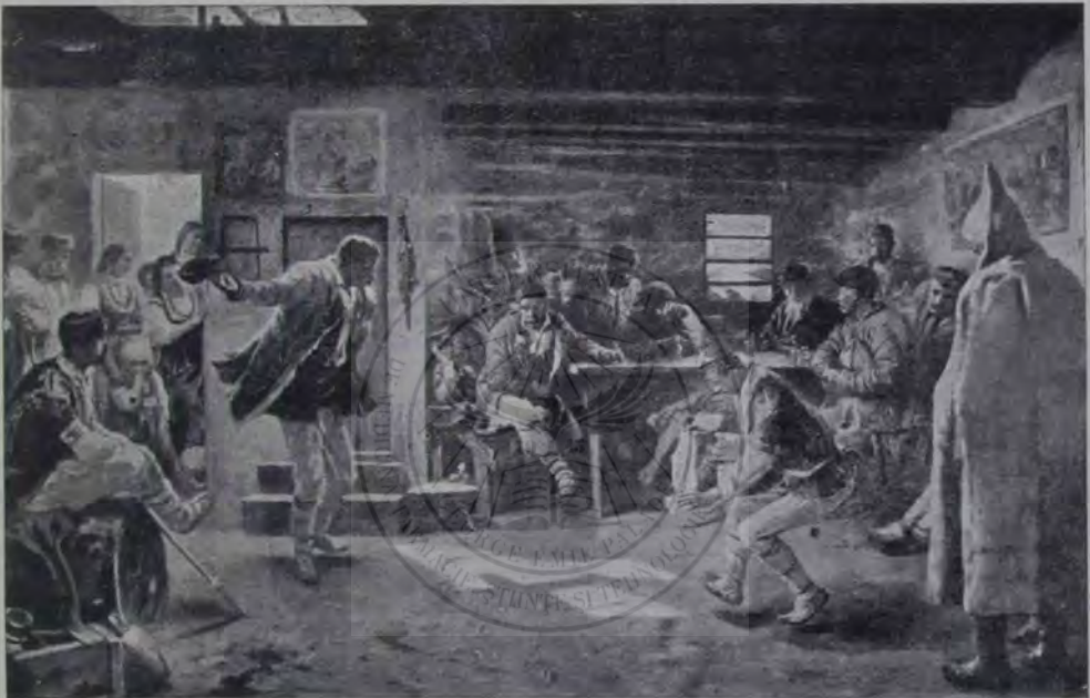
I. Mărkvicka: Jocul național bulgar „Racenița“.

„Din partea căruții cred că nu putem păși nimic, spuse lerotei dupăce o cercetă la toate incheieturile, la roate, cuiele din osii.