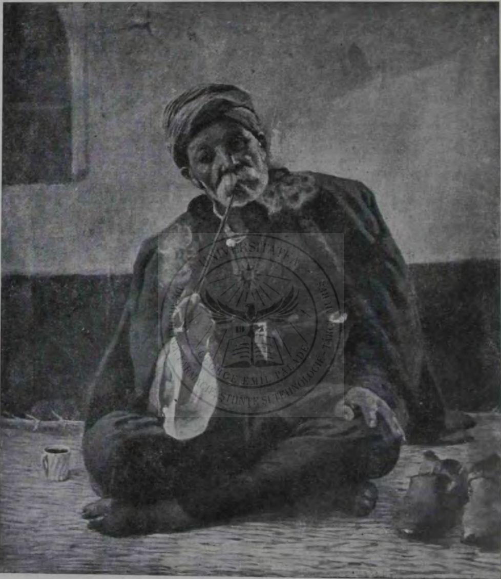
I. Mărkvicka: Turc fumând.

geamantanul, și ieșind zări pe lerotei în curte. De patru ani eră lerotei slugă la popa. Nu fusese căsătorit niciodată, nici nu eră din