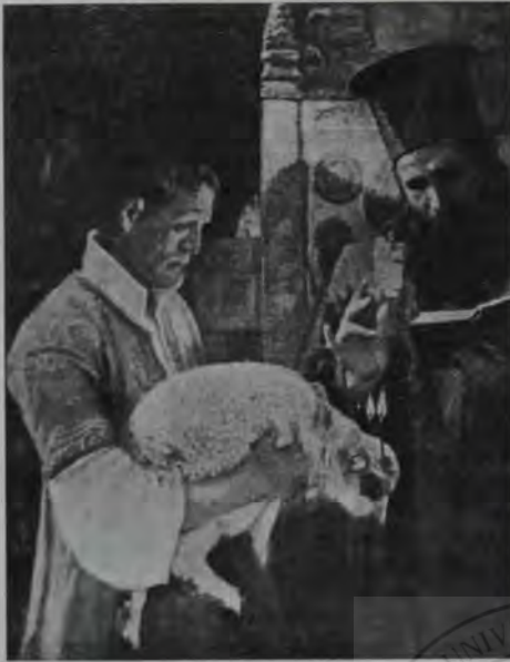
I. Mărkvicka: Jertfa (Corbanul) dela Sf. Gheorghe.

dela ferestre. Intre femei nu se putea vedea aceeași liniște, aceeași neclintire care stăpânea în naia bisericii, între bărbați. Ele se mai spionau din când în când cu privirile, se mai înghioldeau chiar, cercând fiecare să ajungă mai înainte ori într'un loc mai bun. Printre năfrămile scumpe se zăreau și capete descoperite, pletele fetelor tinere.