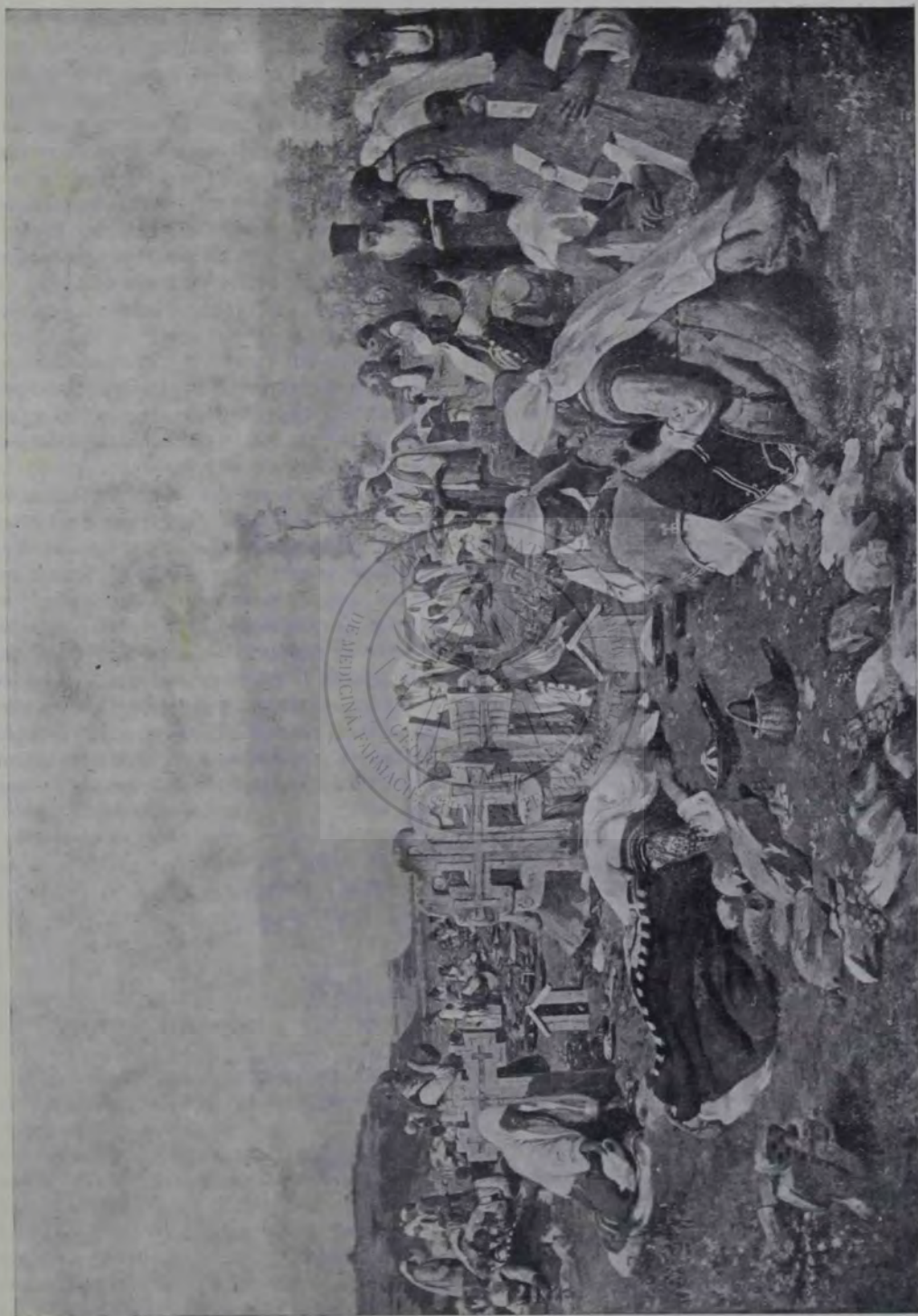
I. Märkvicka: Sábáta morþilor.