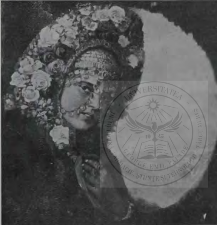
I. Mărkvicka: O mireasă bulgară din jurul Sofiei.

Simțindu-și părintii, casa lor aproape, convingându-se că 'n el sălășluiește o forță nu de toate zilele, după cum putea vedeă din avântul cu care își repetase predica, Vasile Murășanu simția cum îi crește o nouă putere în suflet. Cuteză acum să se gândească liniștit și la visul lui, și la baia „Arhanghelii“, și la notarul Rodean și chiar la Elenuța. Începă numai decât să-și țină o lecție însuflețită de filozofie foarte optimistă. Se convingea cu mare ușurință că adevărata valoare a unui om nu stă în avere nici în poziția socială ce-o ocupă, ci în el însuși. Cât prețuesc cunoștințele, cultura, lupta noastră pentru ideal, atâta suntem. Poate, mai ales, cât prețuesc