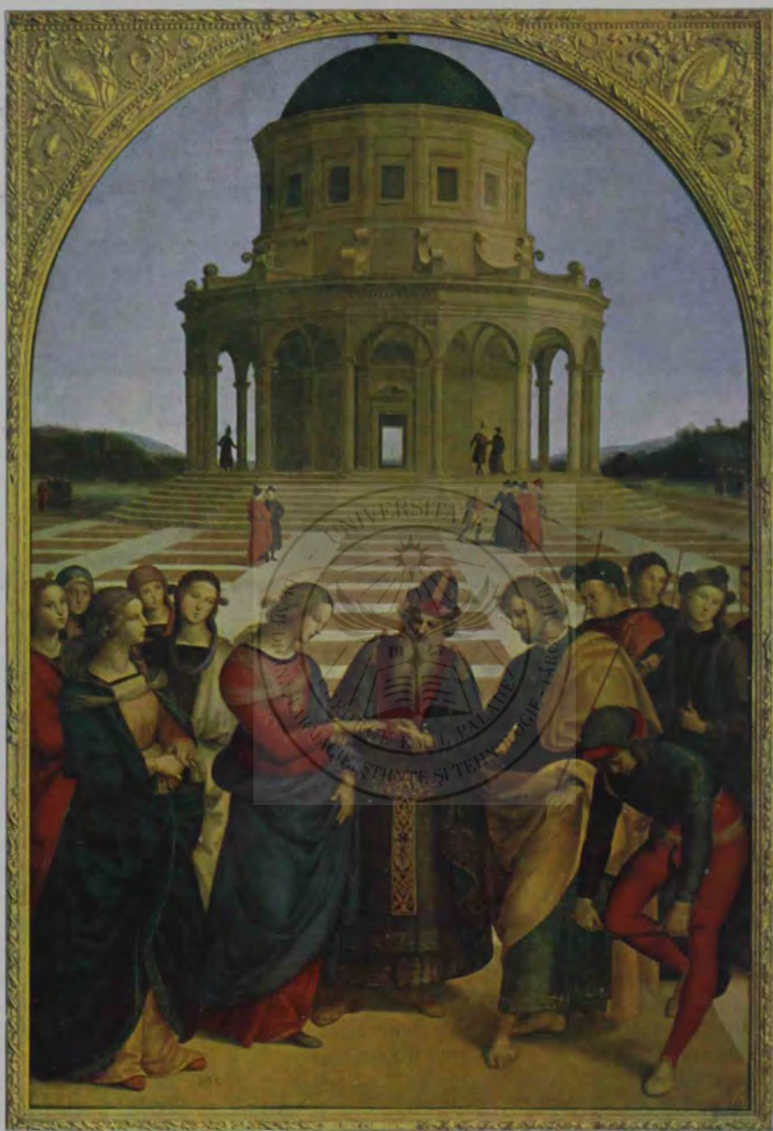
Raffaël: Lo sposalizio