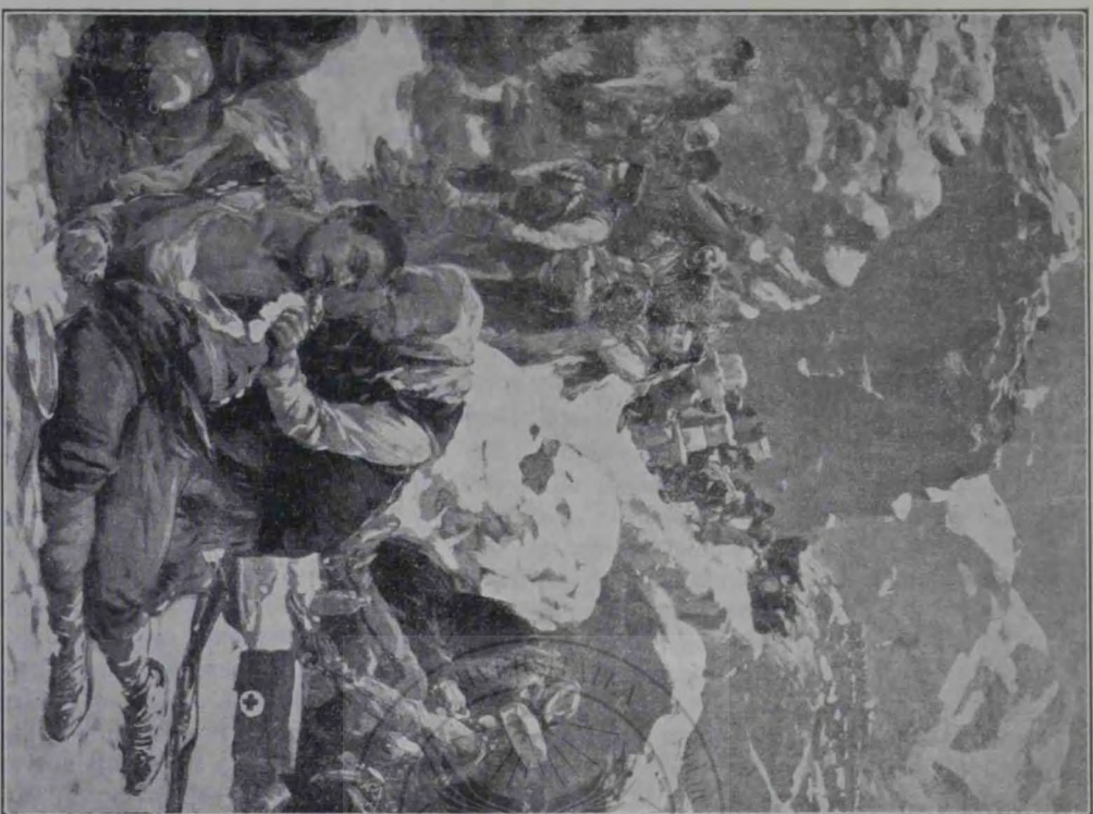
Războiul din Balcani: Lupta de la Taraboş. Femeile munte negre pansand pe răniți.