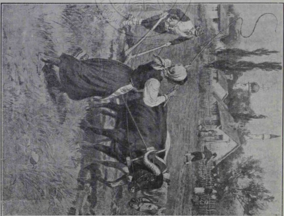
Un turc din Bulgaria la arat.