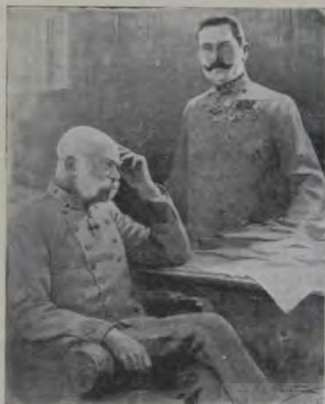
Enigma austriacă: Pace sau războiu?

cheltuieli de câteva sute de mii de coroane anual.