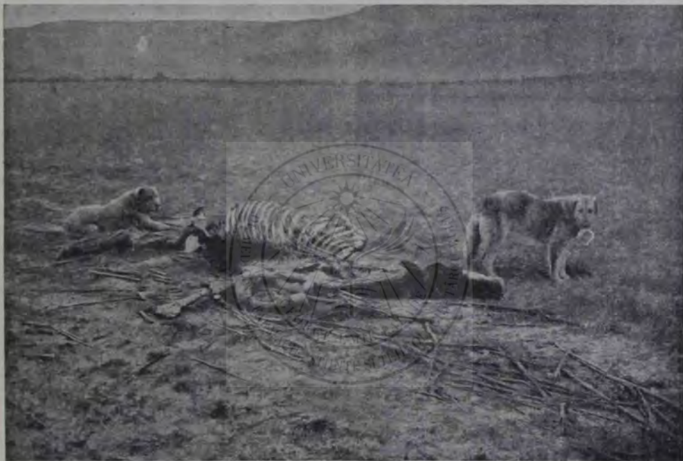
Războiul din Balcani: După lupta dela Ciataldgea.

„la uitaţi-vă, măi, poate aveţi ceva rezervă să mi se potrivească”, începui cu o voce de