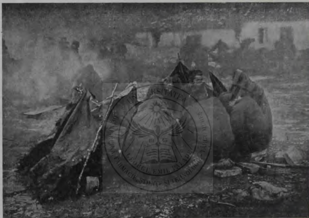
Războiul din Balcani: Popasul trupelor sârbești în Albania, la Alessio, după un marș forțat.

„Că m'am rănit! la să-mi spui tu, că te ții om învățat, pentru ce mama dracului atâta hârșteo-hârșteo? Nu-i seminar românesc? N'om purtă noi bărbi și mustață ca toți popii?”