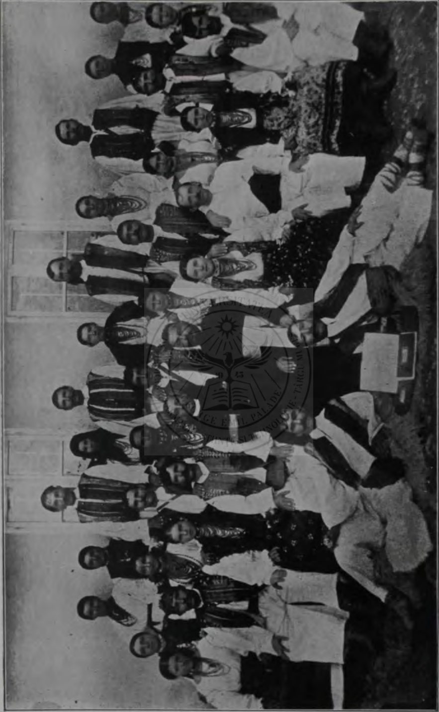
CORUL BIS. A PLUGARILOR DIN SLATINA MARMATIEI.