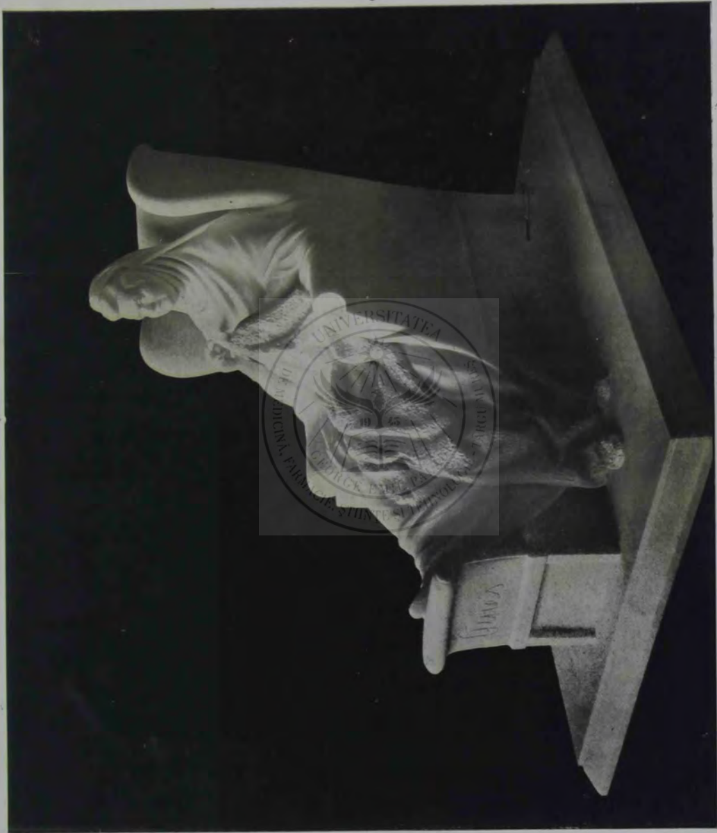
O. SPAETHE: M. S. REGINA ELISABETA.