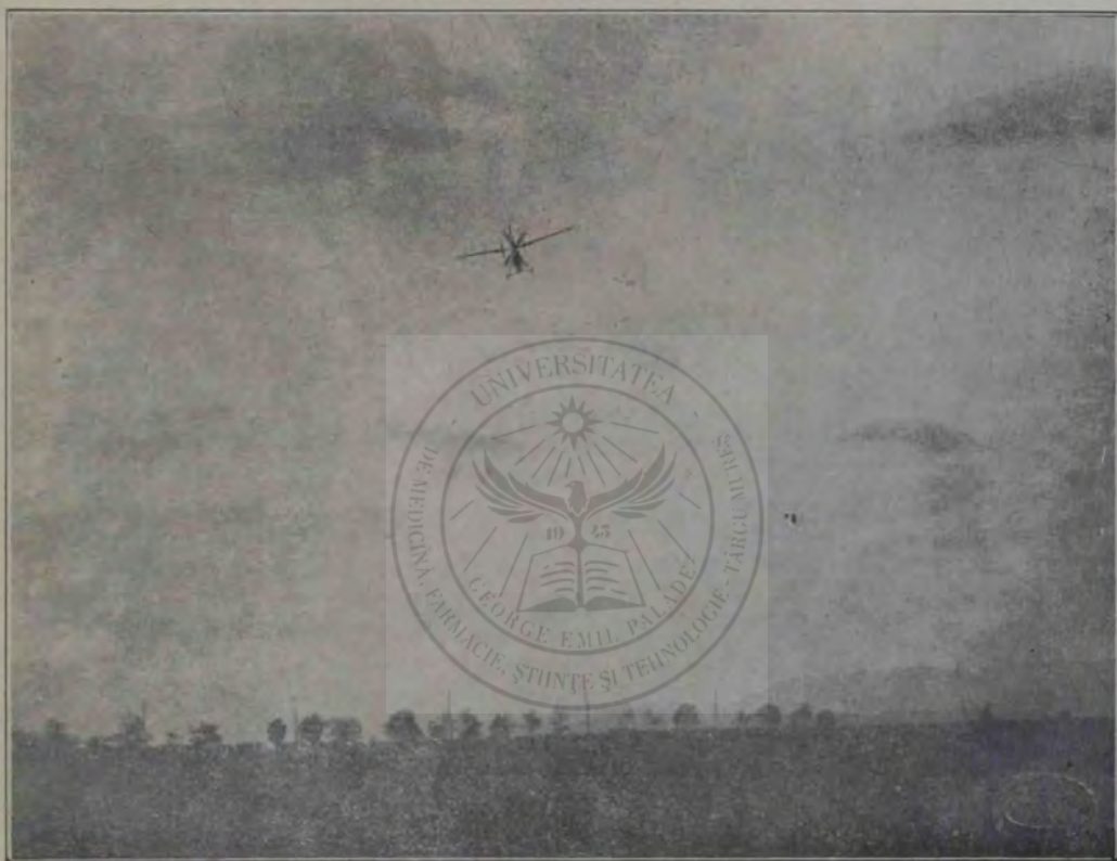
Inginerul Vlaicu în Sibiu, luptându-se cu vântul.

sese să cumpere un clopot pe seama bisericii. Eu mă bălăbăneam în casă la o baterie electrică. Ion se uită pe fereastră, întoarce capul și mi s'apleacă încet la ureche: „Știi ce? Hai să-i scuturăm o leacă!" Zic, bine loane, tu ții aparatul, eu le dau sârmele, da bagă de seamă mă, să nu ridici sus la două sute de volte, că trântim adunarea! Ies pe prispă la oameni, ei cu clopotul... Zic,