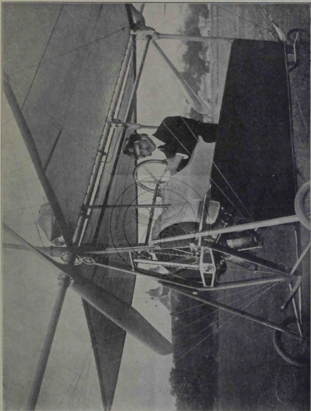
Inginerul A. Vlaicu in aeroplan.