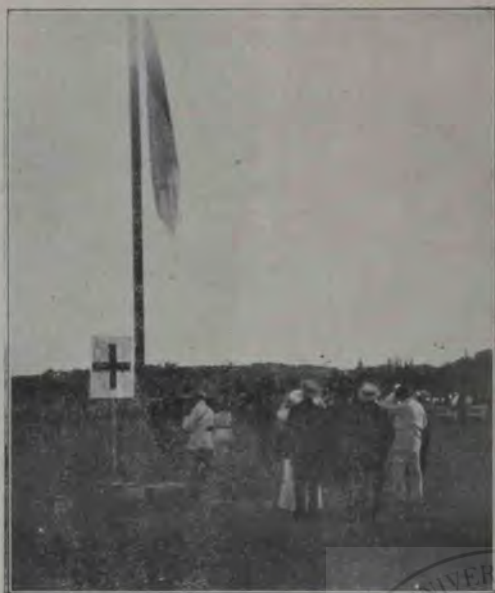
Sborul ingin. Vlaicu în Blaj la o înălțime de 700 m.