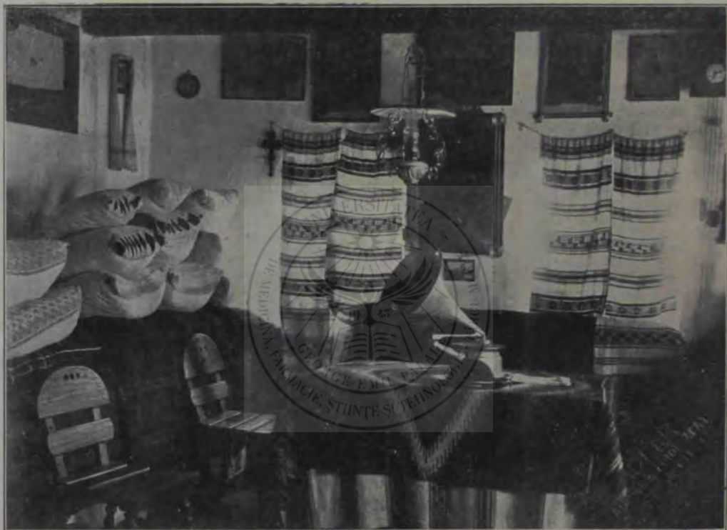
Un Interior al casei bătrânești.

M'au năpădit amintiri de demult... Legă-