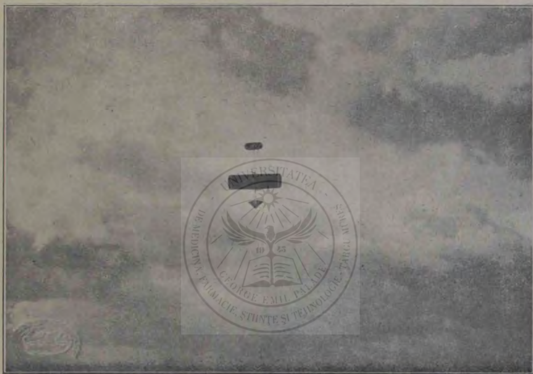
În sbor deasupra Câmpului Libertății în Blaj.

de complicată și subtilă, aranjată de o mână meșteră. Atât de simplu, atât de liniștit și cu atâta siguranță îmi înfățișă acest om cea mai avansată problemă tehnică a zilelor noastre, încât mă uimeă. Mi-am dat seama degrabă că nu-mi vorbește un suflet vulgar. Vedeam, că n'am nimerit un individ dornic de căpătuială care îmbată lumea și umblă după câteva sute de coroane, nici un tresărit