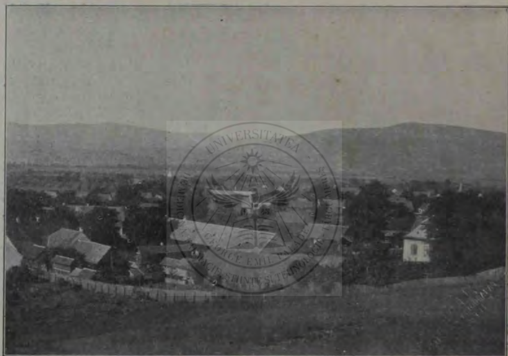
Satul Bințiți, lângă Orăștie.

spuză de vârtelniți, sucale, proiecte de piuă, mori. Mă apropiu de el, eră un om mărunțel, uscățiv, cu ochii vii și neastâmpărați, în ei cu licărirea unei inteligențe de veverită. Bade, — zic, — de unde, păcatele, vii cu minunile astea? — Păi, — răspunde țăranul, — iacă le-am adus aci să le vază domnii! — Cine le-a făcut? — Eu, cin' să le facă? — zice el dând din umeri... Așa, adică d-ta ești măsar? Ba n'am fost de când sunt! Un om pe aci