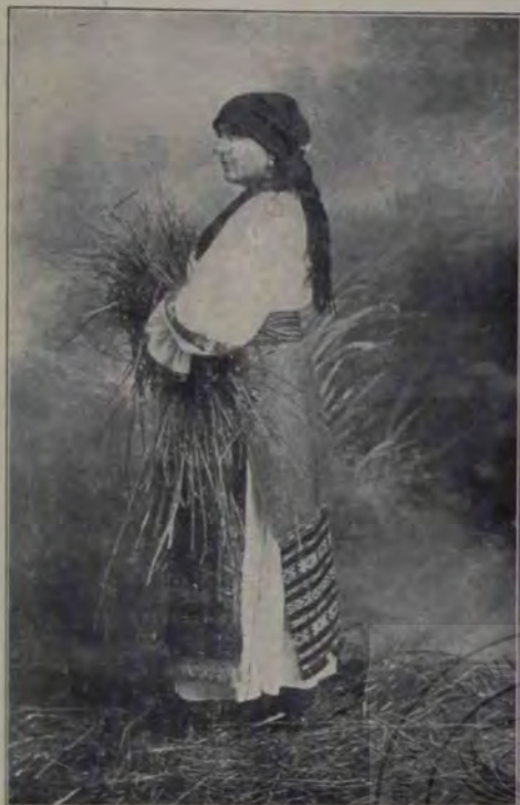
Port de pe Valea Someșului.

ostenesc, să cerceteze cu mintea tainele fapturii lor slabe.