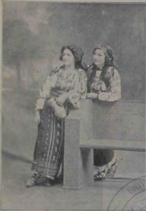
Balul din Sibiu: Port din Bran și Toplița-română.