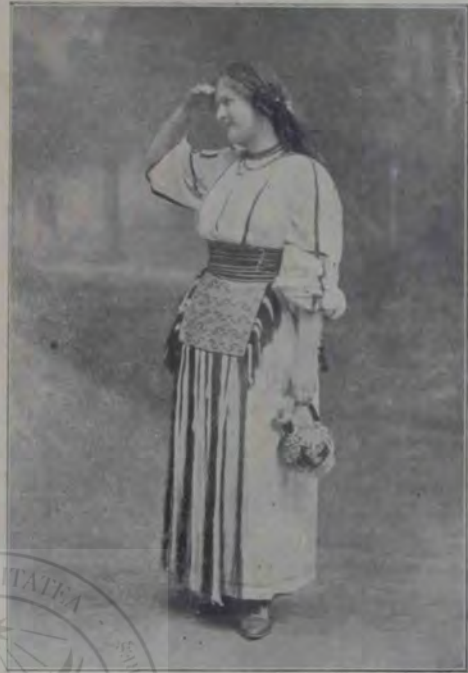
Balul din Sibiu: Port din Bănat.

marazi, și cu dragostea de a face bine și de a statornici o frăție adevărată, l-am luat cu mine.