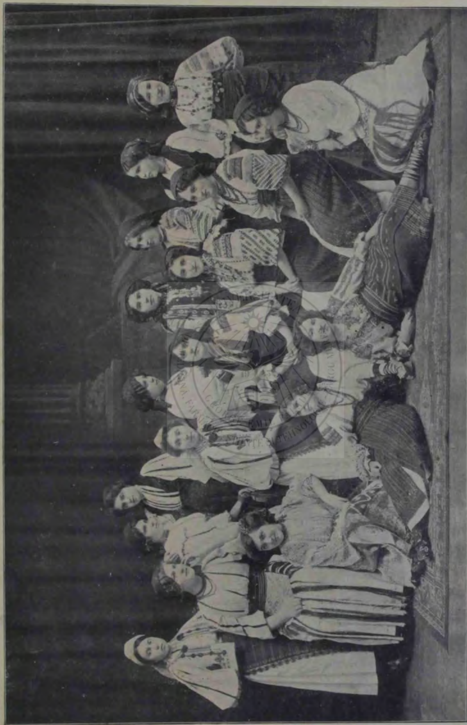
Elevele școlii de menaj din Sibiu.