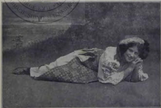
Balul din Sibîiu: Port din Bănat.

Însă unii dintre oameni, ca să pară mai distinși, ori ca să nu se arate robiți femeilor, se prefac că înăbușe gelozia. Și cred oamenii aceștia, că sunt virtuoși, dacă nu mai bagă de seamă la gesturile prietenilor și dacă nu se mai