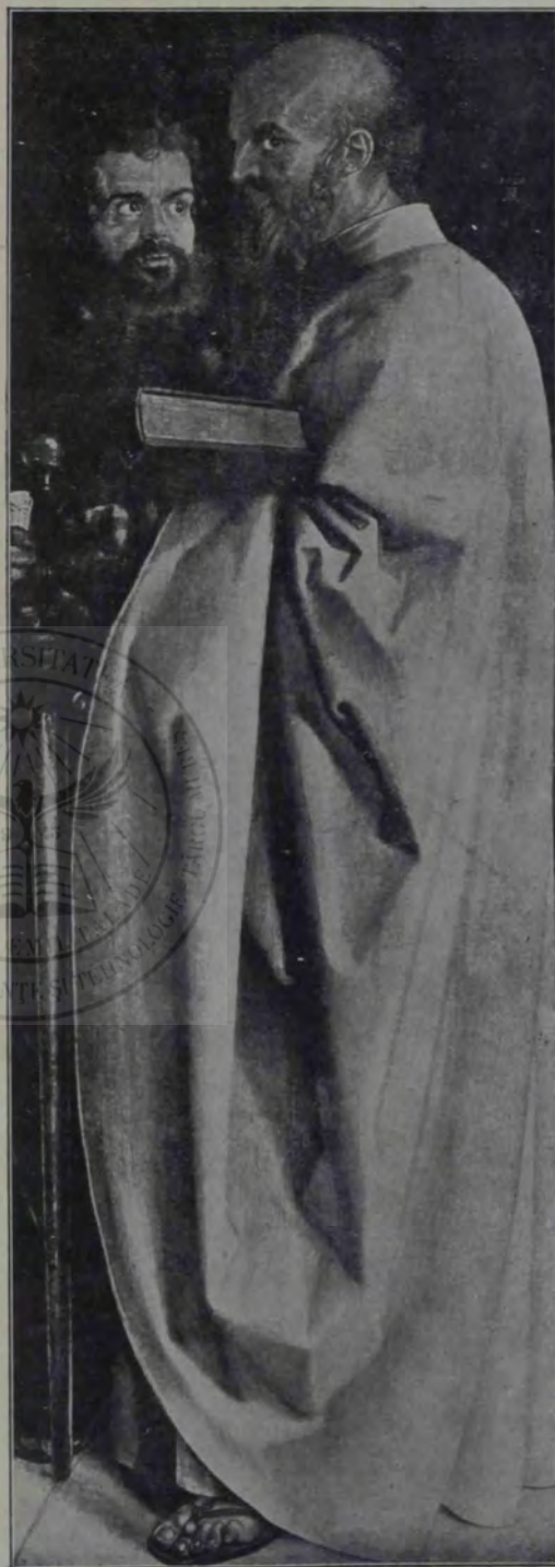
A. Dürer: Apostoli.