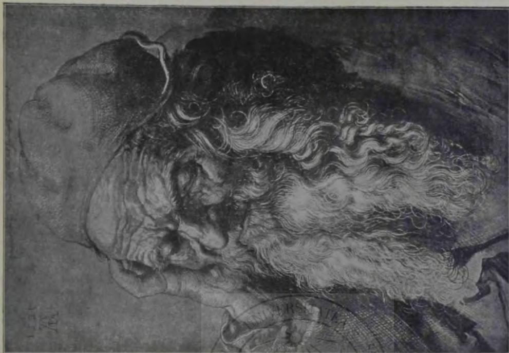
A. Dürer: Cap de moșneag.