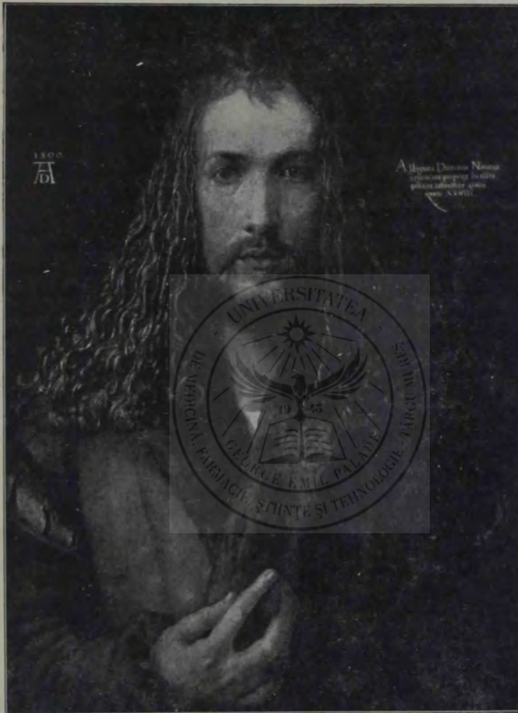
Albrecht Dürer: Autoportret.

Îl iubeau femeile căci eră frumos. Înalt, odată și jumătate; lat în piept, că atunci când și-l umflă îi plesneau nasturii, — cu