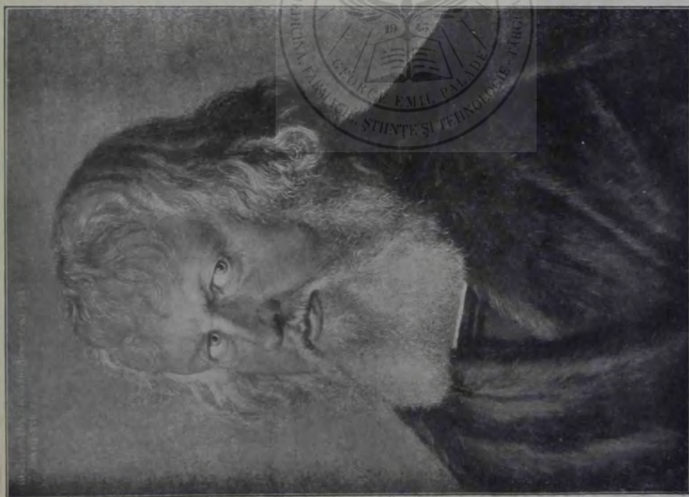
A. Dürer: Hieronymus Holzschuher.