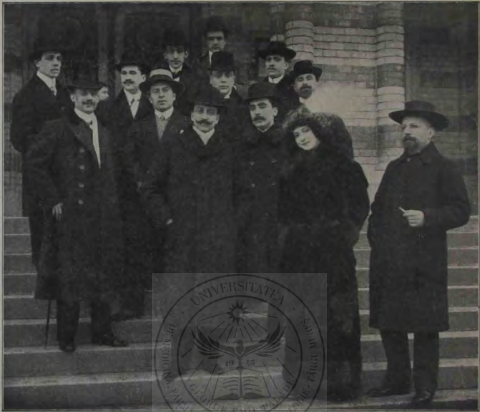
Un grup de scriitori, ieșind din biserica catedrală: