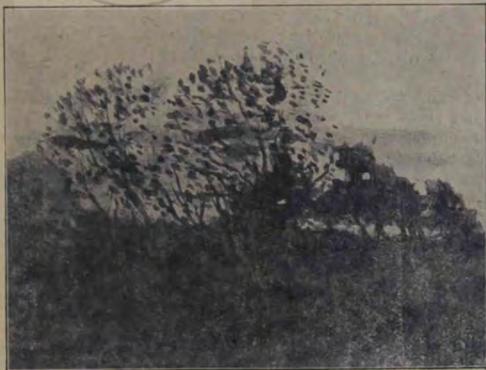
St. Luchian, Peisaj.

și chiar dureroasă. În dosul fiecărei priveliști ce ne dă s'ascunde par'că o tragedie. Uită-te la »Peisaj de toamnă«, una din cele mai reușite compoziții, și vezi cum se îngrămădește și se frîmătă masa enormă a norilor de plumb! Inima omenească suspină și se frînge sub povara lor, presimțind toată mizeria lungă și amară a iernii care s'apropie. Aceeaș filozofie sumbră se revarsă peste »Casa din Câmpulung« și peste pustia »Casă boierească«. Un înțeles oarecum simbolic înfățișează din acest punct de vedere