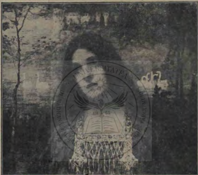
Kimon Loghi, Princesă bizantină.

nostru bine cunoscut, stabilit acum în Paris, ne trimite 13 pânze, cam de aceeaș factură și valoare, mai toate din domeniul peisajului, în care s'a deosebit și până acum și pentru care a fost medaliat la expoziția internațională din München. Năzuința sa însă nu-i să ne dea realitatea nemijlocită ca bunăoară naturalistul Verona și nici natura de combinație coloristică sentimentală, ca simbolistul Loghi, și nici schița pitorească a peisajului grigorescian, ci un peisaj, care, ce e drept, are ca bază reală natura, dar natura exploatată în vederea unui efect exterior. El stilizează, armonizează datele obiective, dar nu spre a ne dispune și a ne mișca inima ca Loghi, ci spre a ne cuceri ochii, dându-ne ceva din ființa