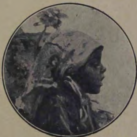
Ip. Strâmbulescu, Țigăncușe.