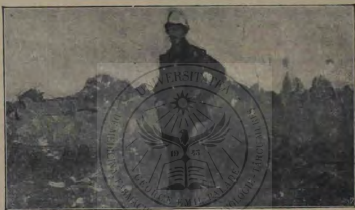
G. Pătrașcu: În amurg (studiu).

un miel și să vezi, că se fac, cu vremea, tot mai mulți.