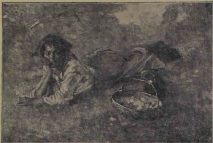
N. Vermont, Pe iarbă.

și parfumul frumosului. Aceasta înseamnă că el, fostul elev a lui Gysis, e un talent esențial decorativ, și e păcat că nu-și continuă studiile sale mai importante și mai originale din cu-prînsul artei româno-bizantine. Foarte interesantă e pânza sa »Moș Ilie din Răducești«. E un tip de țaran român bine ales. Pe obrazi-i supt și osos, dar încă vânos și resistent, cetim bunătațe, blîndetă, resignare, dar nu umilită. E cu adevărat Moș Ilie, omul așezat și de treabă, limpede la cap și simpatice; în totul un bătrîn din eposul vremii apuse, dar tipic ca român. Toate trăsăturile, toate detaliile — chiar și țepușele albe ale bărbii nerase — sunt redată cu scrupul. Dacă tipul e real, îi lipsește însă viața intensivă, hotărîrea și vigoarea colorii și desemnului, care-i necesar spre a-l face de sine stătător. Tonurile învăluite și reci și sficiunea modelării îi iau par'că prezența corporală și ne fac să-l socotim mai puțin ca portret decît ca un fragment al unui panou decorativ.