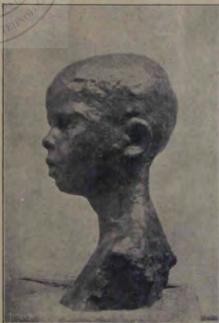
C. Brâncuș: Bust.