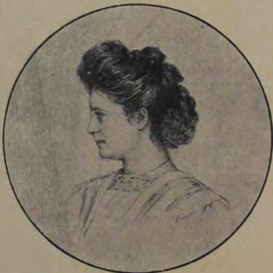
C. Artachino, Desen.

N. P. Loco. Răspunsul »positiv« ce vi-l putem da fragmentului fantastic e: nu! Sentimentele naționale