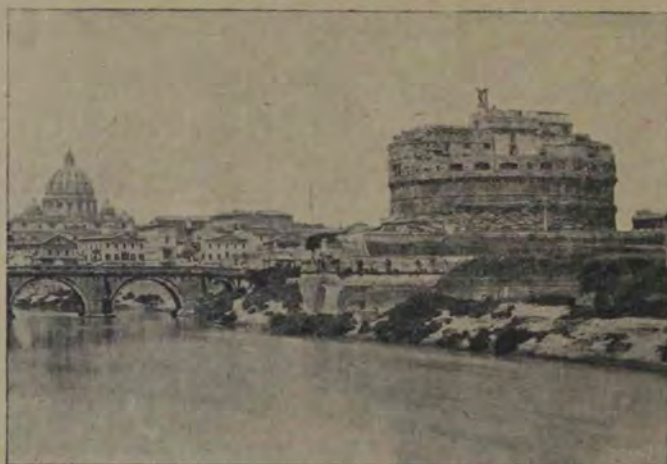
Mausoleul lui Adrian sau Castelul S. Angelo. (Stare actuală. — În fața Tiberul și podul S. Angelo, în fund Sf. Petru). Vederi dinspre U. E.

arhitectonică a geniului roman și nimic nu ne împiedecă a o socoti ca atare.