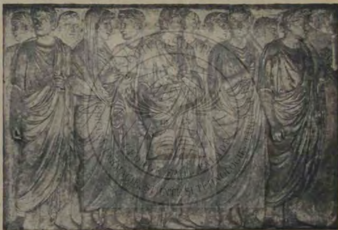
Ara Pacis. Relieful procesiunii (Florență).

zeități, din cari făceau parte, cum văzurăm, zeul Marte și Venera; acum sunt prefăcute în capete și cripte pentru familia regală (o inscripție și un bust dela stânga noastră ne înștiințează că acolo zac și rămășițele lui Rafael). Fiecare nișă are în față