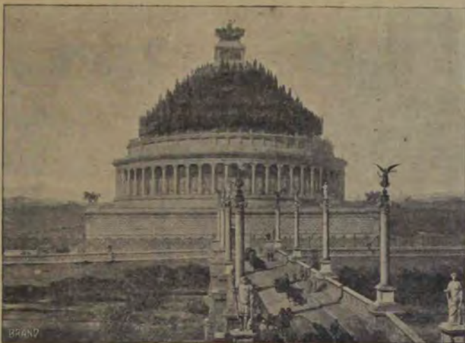
Mausoleul lui Adrian. (Reconstruire).

Modelul acestor sculpturi a fost fără îndoială celebra friză a Partenonului; dacă concepția lor nu are originalitatea și vioiciunea acesteia, dar ea, deși e stânjinită de un spațiu restrâns, dovedește un puternic simț estetic, aproape neîntrecut până la această epocă din punct de vedere decorativ. Tendința națională nu se constată numai în aplicarea tehnicii eline la obiecte și forme romane, precum și în reprezentarea lor mai realistă, ci și în materialul întrebuințat