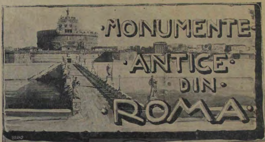
Mausoleul lui Adrian în starea de acum, vederea din față.