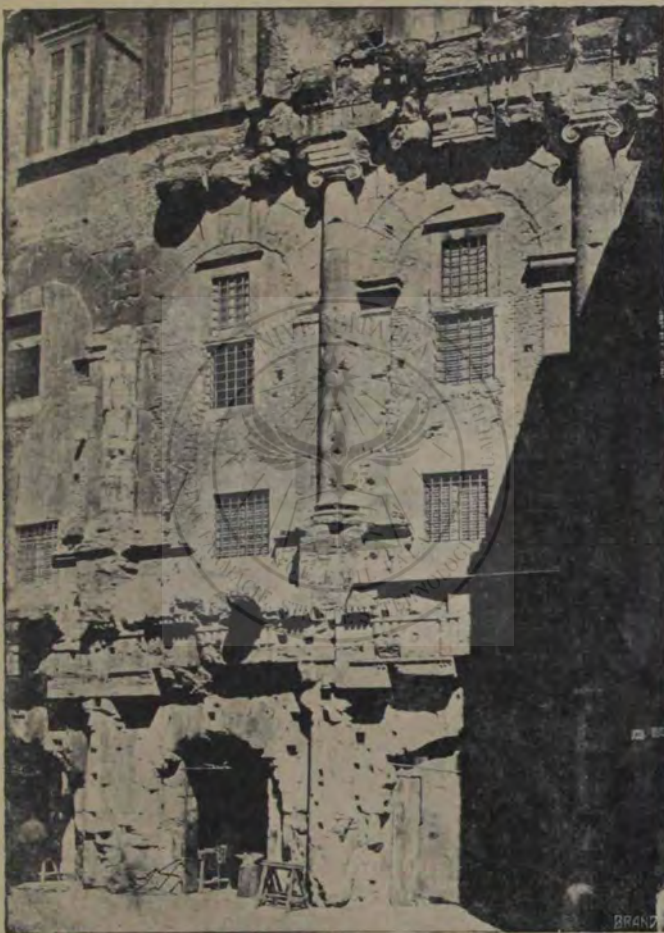
Teatrul lui Marcellus.

în Orient. Îl cunoscuseră și-l aplicaseră și Grecii în epoca elenistică; dar nicăiri nu ne întimpină în proporția, soliditatea și splendoarea celei de față. Vrednice concurențe ale ei sunt câteva cupole creștine (Sf. Sofia, S. Petru, domul din Florența); dar ele, pe lângă că sunt făcute cu mult mai târziu și, cel puțin în parte, după muștra acesteia, nu pot nici decum să micșureze adâncimea impresiei ce o produce această boltă. Știm că arhitectul, nemuritor al Sf. Petru visă