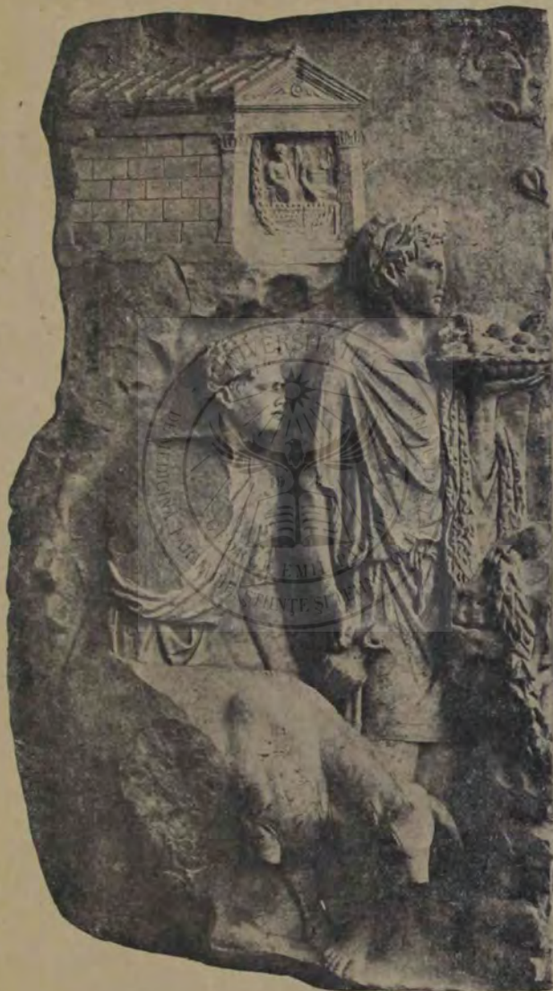
Ara Pacis. Pregătire de jertfă. Fragment (Museo delle Terme).

din zidărie de cărămidă, și din porticul cel de marmură și granit dela intrare. Felul nesimetric și prea puțin organic cum se leagă între sine aceste două părți ale clădirii printr'un corp mijlociu, vestibulul, a cărui față proprie răsare deasupra fațadei porticului, arată în chipul cel mai vădit că ele nu aparțin aceluiaș plan și aceluiaș timp. Îndoiala aceasta tehnică a găsit un puternic razim în dovada ce a dat-o cercetarea unui număr de cărămizi din masivul zidului pe care stă întipărită marca epocii lui Adrian. Apoi un ultim argument împotriva părerii tradiționale, mai e și faptul că bolțile în stil mare încep a se face abia pe timpul lui Adrian, câtă vreme sub August ele nu se pomenesc nicăiri. De altfel nici nu-i de mirat că Panteonul ar fi o lucrare de mai târziu, dacă știm că el a suferit de incendiu sub Titus, a fost reînalt sub Domițian și apoi iar a păgubit sub Traian. Deci cu greu poate greși socoteala