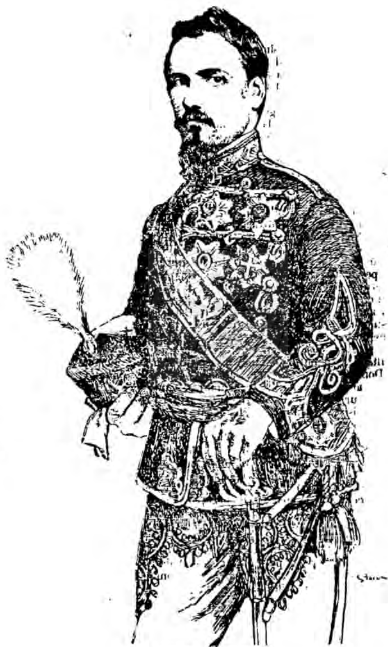
Alexandru Ioan I-l6 Cuza.