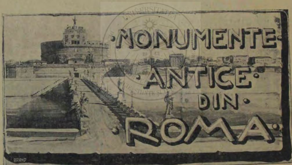
Mausoleul lui Adrian în starea de acum, vederea din față.