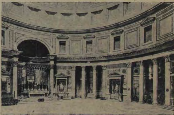
Panteonul. (Interiorul în starea actuală).

Populația capitalei, mereu înmulțită, se re-