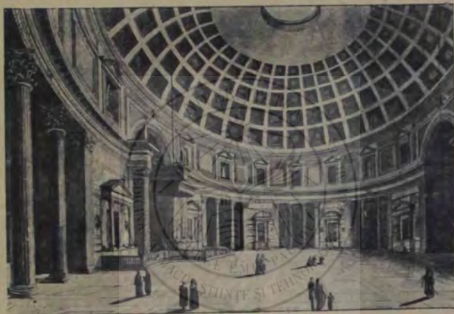
Panteonul. (Interiorul. Reconstruire).

negotului și comunicației. Pe alocuri se vedeau grădini și parcuri cu cărări umbroase îmbătate de mirezme, în care ziua foiau și-și omorau vremea oamenii buzurului și îndemănării, iar noaptea își pierdeau pașii grupurile chefuitorilor și fericitilor, sau — ca și Didona lui Virgiliu în iad — umbrele celor nefericiți. Un prilej pentru clădiri de lux l-a dat Via Flaminia: pe laturile acesteia, ca și la Via Appia, se înșirau, care de care mai frumoase și împodobite cu statuile celor mai de frunte bărbați și femei, mormintele și mauzoleele familiilor nobile. Printre ele locul dintâi îl ținea mauzoleul lui August.