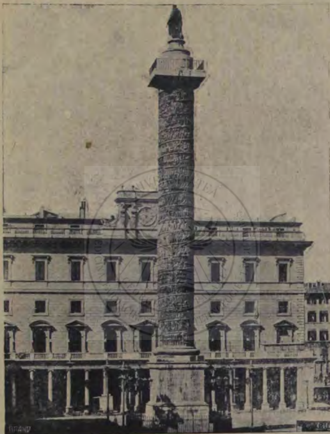
Columna lui Marc-Aurel.

Câmpul lui Marte a fost cel mai puțin încercat de hărlețul învățatului. Ce amintiri prețioase tănueste el, o putem bănui după descoperirile de până acum. Și cum poate fi altfel, când știm ce bogată și glorioasă viață istorică s'a desfășurat pe acest câmp, ce grozăvie și mândrețe de așezăminte publice și