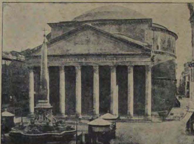
Panteonul. Vedere din față.

Altarele și locașurile sfinte se înmulțesc, cele publice asemenea. La sud se vede în chip de strungă localul adunărilor poporului (comitia centuriata), Ovile; alături era Villa publică, adăpostitoarea solilor străini. Mai încolo templul lui Apolon, al Belonei, al lui Ianus, al lui Vulcan, al zeiței Spes. Un moment hotărâtor a fost când, înainte de războiul al doilea punic, învingătorul Celților C. Flaminius a deschis spre nord Via Flaminia. Această cale, continuată în cetate prin Via Lata, al cărei moștenitor e astăzi pomenitul Corso, străbatea întreg Câmpul lui Marte, despărțindu-l în două și mărginindu-i de atunci numele în latinea mai ales nordică despre Tibru.