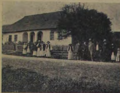
Banca românească »Codreana».

tească. Și fiindcă nu putu răbdă prea mult focul acelor ochi, care i se revărsă în piept în valuri arzătoare și îi tăia răsufierea, Radu sili pe Ilie să mai bea și beu și el. Ilie goli paharul dintr'odată, apoi se sculă repede în picioare, se clătină și căzu iarăș pe scaun, se mai sculă încă odată, și impletectindu-se se îndreptă spre ușa din fund. Cărciumarul se repezi după el. Maria surise.