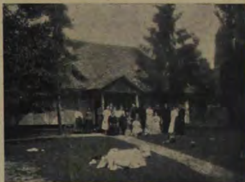
Casa parochială din Băsești.

Și își lipi mai întâi nasul plin de țărână pe obrazul lui Radu, apoi pe al Mariei și când voi să-și arate în acest chip dragostea și față de cârciumar, acesta se desfăcū binisor din brațele lui.