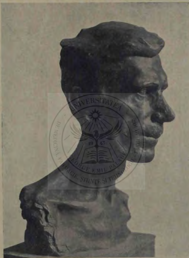
O. Spaethe: Pictorul Luchian.

... În seara aceea se culcă de vreme și adormi foarte repede. Se deșteptă prin puterea nopții și fără multă șovăire porni spre han. Visase că erau hoți înlăuntru și acum, deșteptat, lucrul nu i-se părea cu neputință: își aducea aminte că hangiuul, ca adesea-ori în vremea din urmă, adormise pe masă.