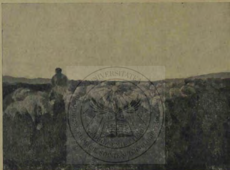
Luchian: Păstor cu țoi.

Părul bogat și negru ca noaptea, desprins din inelul de lănișoară roșie, se resfiră o clipă căzînd ca o undă de întuneric de jur împrejurul trupului tînăr. Prins apoi între degetele