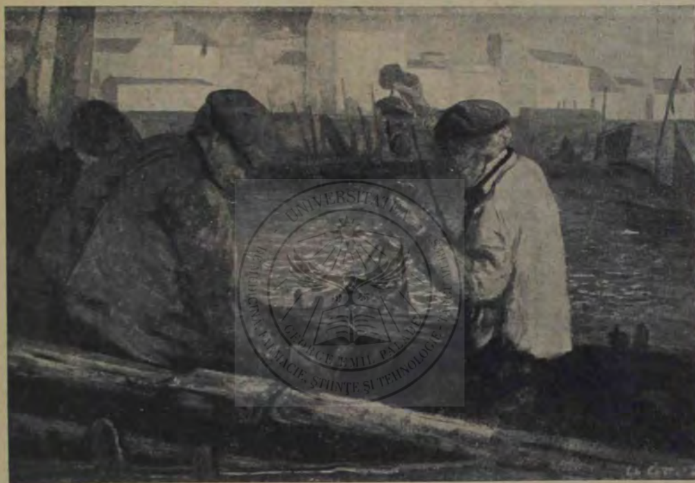
Cottet: Pescari în port.

Când a venit el pe moșia boerului Răsmiriță, hanul dela trei movile eră ținut tot de Cristea Mocanu. Câtva timp s'au avut foarte bine amândoi. Hangiul fusese vagmistru în regimentul 3 de artilerie din Brăila. Iși povestiră unul altuia întâmplări hazlii din armată, se întrebau de semnale și râdeau când unul din ei