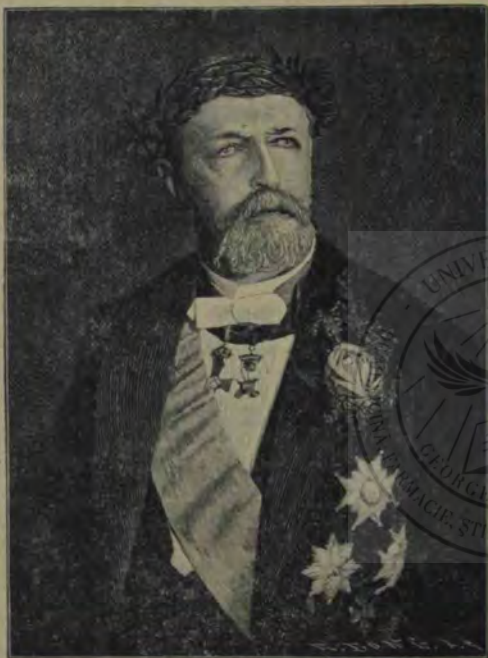
Regele Oscar II al Suediei.

Regele-poet, Oscar II al Suediei, a încetat din viață la 8 Decembrie a. tr. Născut la 21 Ianuarie 1821 la vârsta de 42 ani urmă tatălui său Carol XV. Venind la tron găsi în Stockholm o situație politică cât se poate de încurcată, și în tot timpul domniei sale, suferi mult, din pricina vecinicilor temeri de lupte civile. Dacă a putut să menție o oarecare liniște, a fost numai grație spiritului său împăciuitoar și simpatiei, ce curând știu să-și câștige chiar și dela unii politiciani ai Norvegiei.