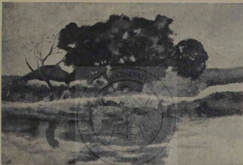
☞ Luchian: Peisagiu.

Meșterul nu bănuise cât aveă să crească fata de voinică și-acum, pieptărașul mai ales, nu se